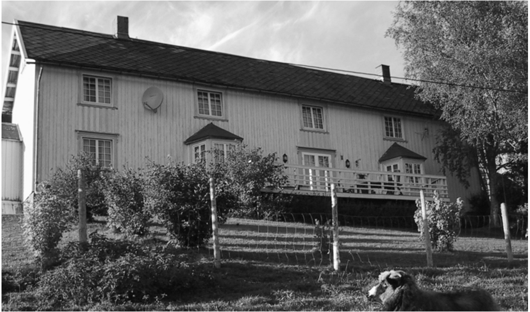
Engelsåsløkken i september 2001 - huset ble flyttet fra Estenstad gård i 1917.