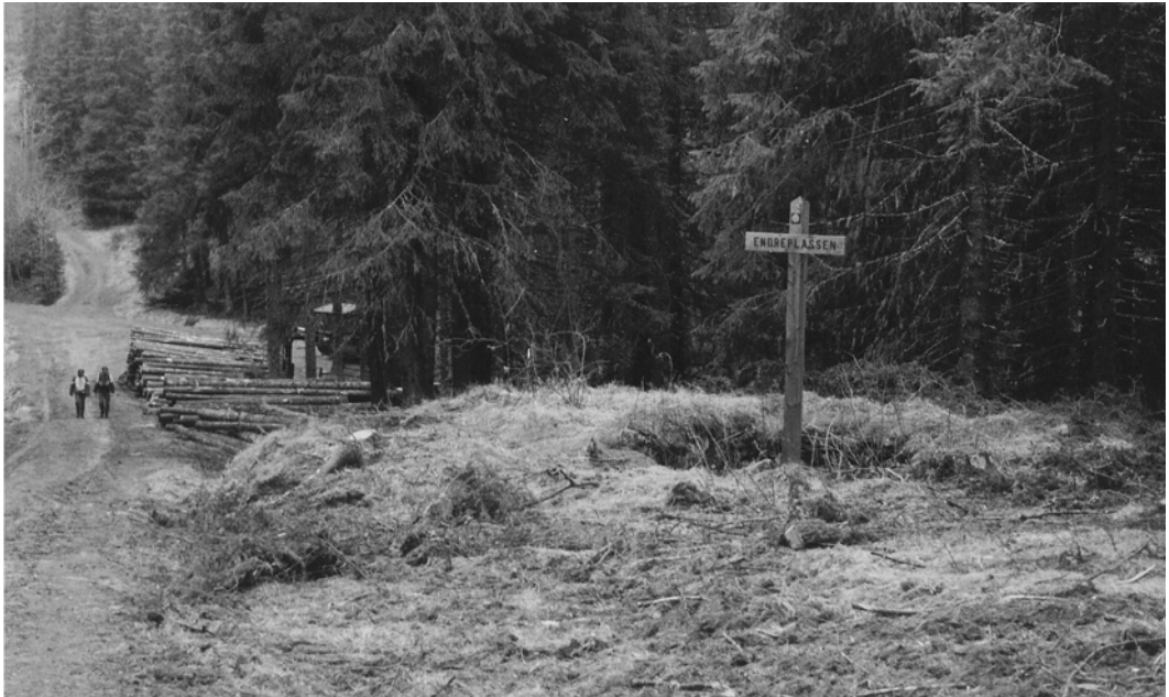
Endreplassen våren 2001. Skiltet står i restene etter kjelleren.

Etter fastlegging av nedslagsfelt og en del arbeid med saken ble kommuneingeniøren i Bærum, Claus Bergh, tilsatt som teknisk konsulent. I 1910 ble Estenstad kjøpt. Planer og overslag utarbeidet av Bergh ble behandlet og vedtatt av Herredsstyret den 26. 11. 1911. Overslaget lød på kr. 250 000. Nedslagsfeltet til Estenstaddammen ble målt til 1.24