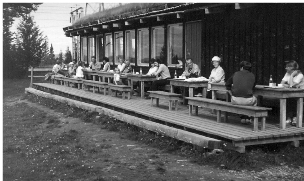
To bilder tatt på samme tid av Estenstadhytta før utbyggingen i 1974