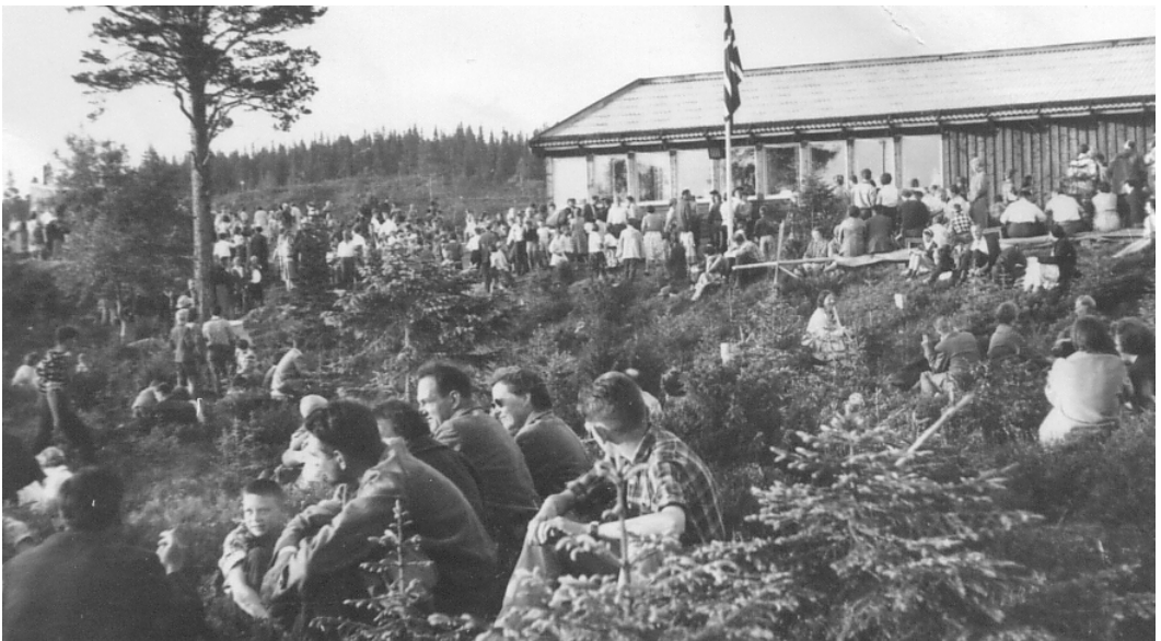
Fra åpningen av Estenstadhytta 12. juni 1959.