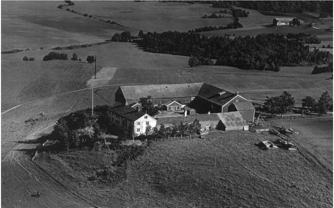
8. juli 1952