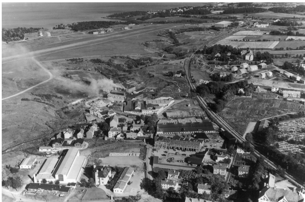
Bilde tatt 31. august 1951 av Widerøes Flyselskap. Kopi fra Universitetsbiblioteket i Trondheim