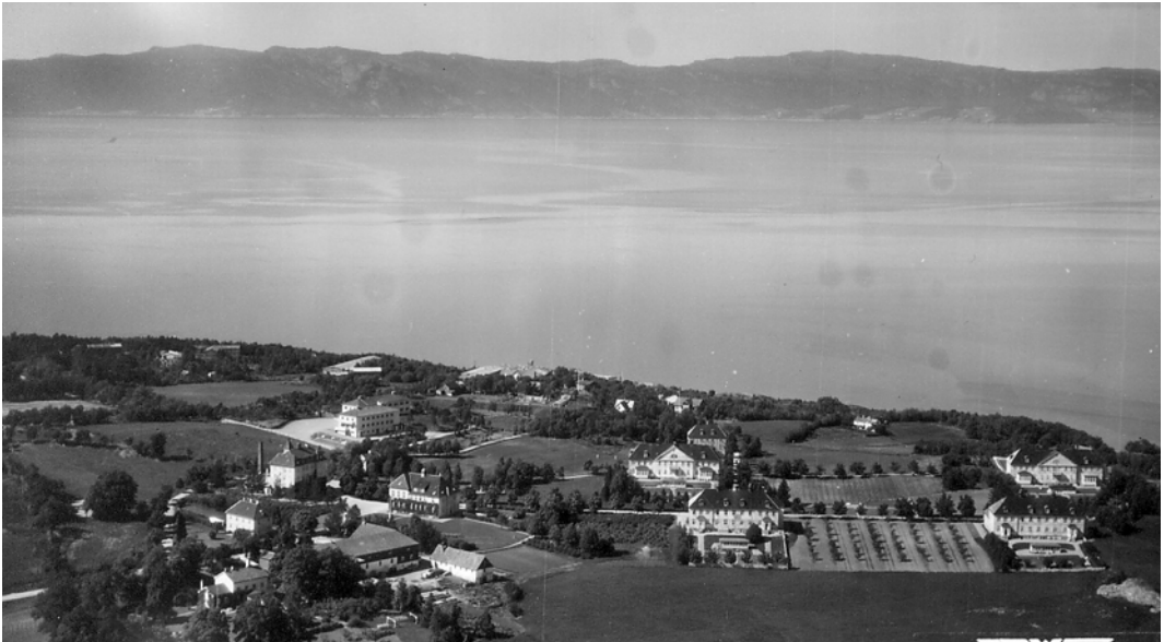
Bilde fra rundt 1950