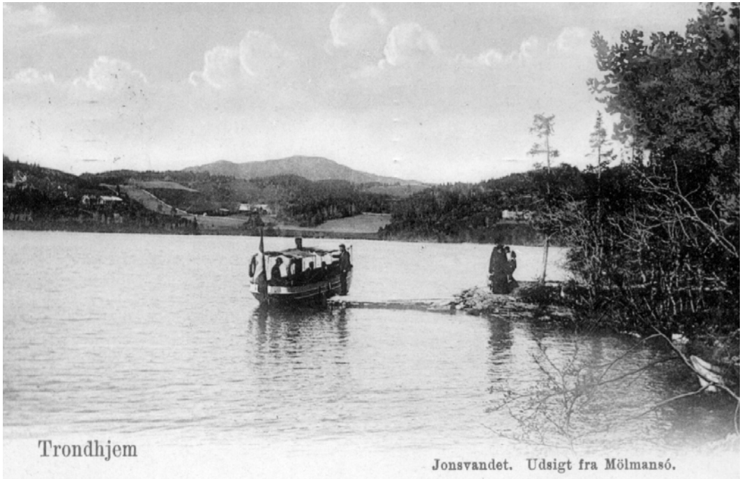
Postkort brukt 1906. Utgitt av J & Co - nr. 150