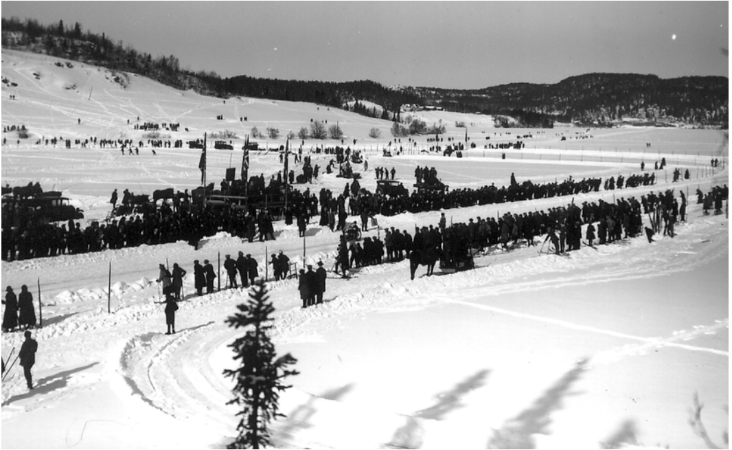
Kopi fra Universitetsbiblioteket i Trondheim