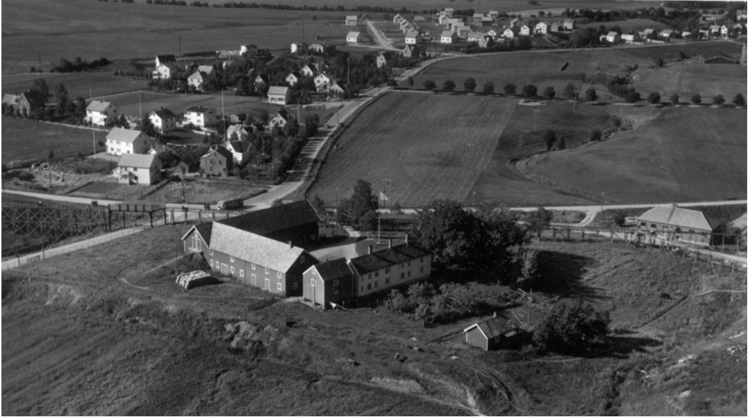
Fotografert av Widerøes Flyselskap 8. juli 1952.

Kopi fra Universitetsbiblioteket i Trondheim