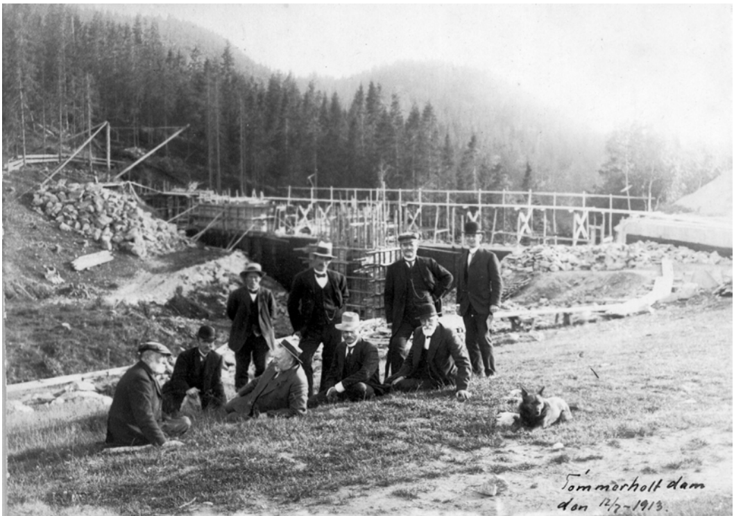
Ved Tømmerholt dam 12/7 1913.

Den 26. november 1911 vedtok herredsstyret å sette i gang arbeidet på grunnlag av beregningene til Claus Berg. Det ble bevilget kr. 250 000, hvorav kr. 46 000