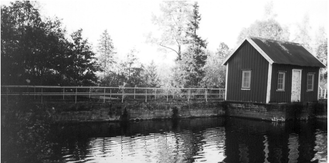
Tømmerholt dam på slutten av 1990-årene.

Utover høsten ble flere abonnenter tilknyttet ledningene, særlig på Blussuvollledningen og den delvis fullførte