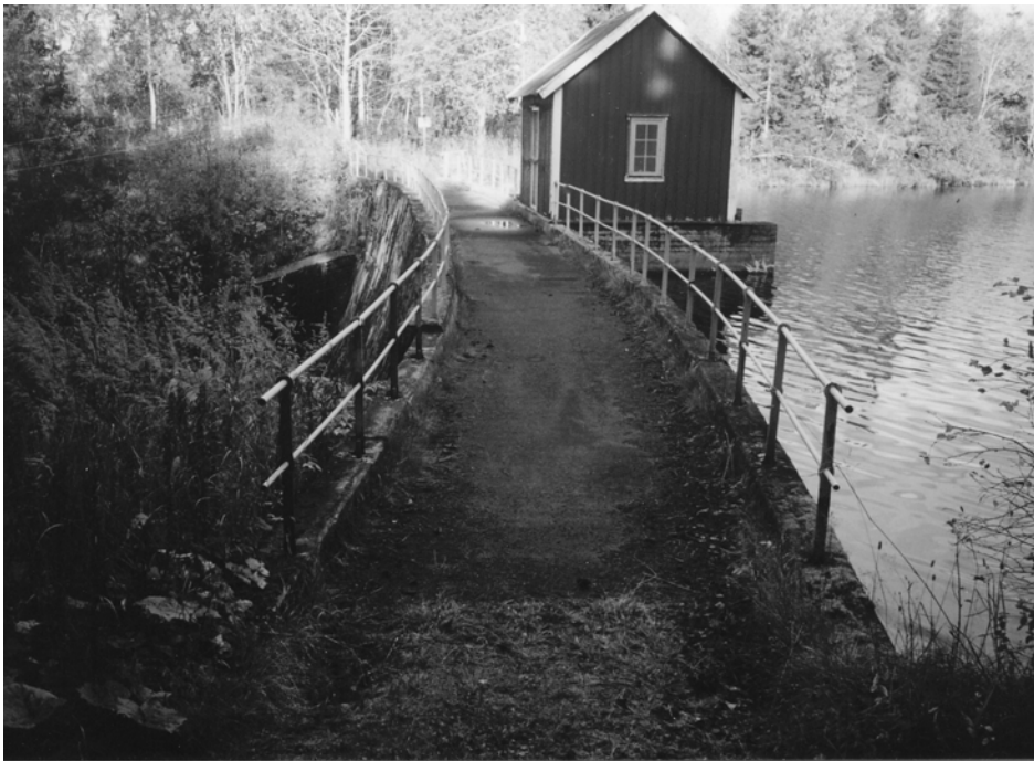
Tømmerholt dam på slutten av 1990-årene.

Mens arbeidet paa denne ledning fuldførtes sattes de allerede lagte ledninger i fuld stand, ledningerne spyledes, brandkummer rengjordes og brandventiler paasættes.”