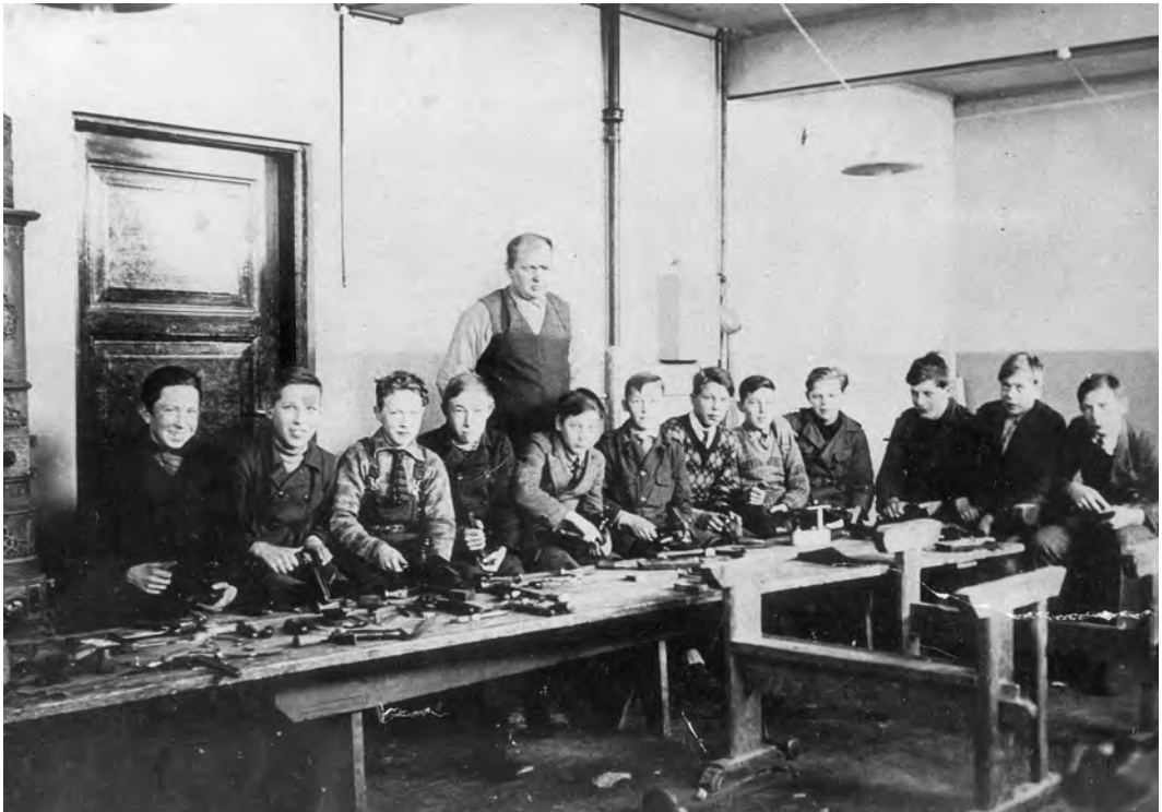
Bilde fra skomikkundervisningen på Åsvang skole. De fleste av elevene ble født i 1916, og bildet er tatt ca. 1930. Læreren het Wulf.