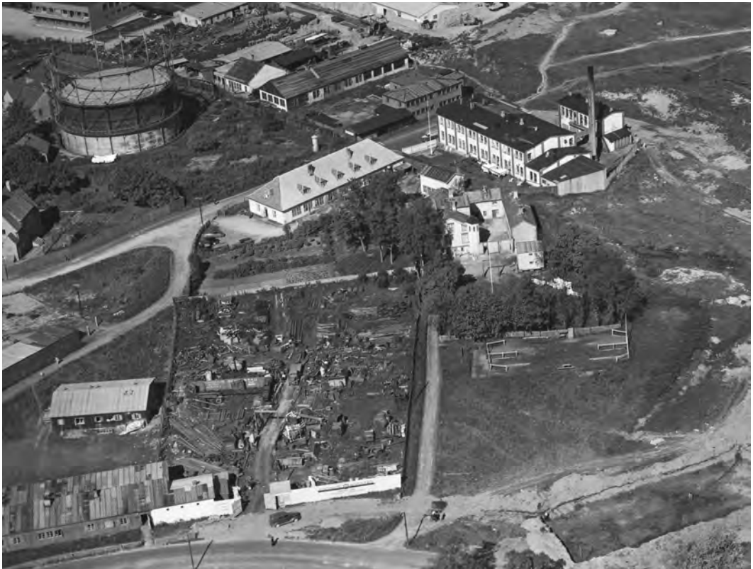
Utsnitt av flyfoto fra 9. juni 1953. Fridheim er midt i bildet. Bak er Dampvaskeriet. Den runde tanken er gasstanken til gassverket. Gassverket ble flyttet fra Kalvskinnet til dette området i 1917, og nedlagt i 1957.

En kan på denne måten håpe på at stiftelsen skal bli et virkelig hjem hvor det ikke bare medbringes nyttige kunnskaper og ferdigheter, men også hjemlige