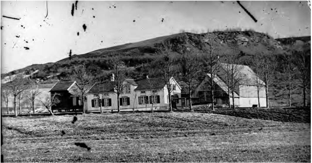
Et gammelt glassplatebilde av Hegdalen på Moholt. Vi ser sørøstover. I lia bak gården er det nå tett med hus.