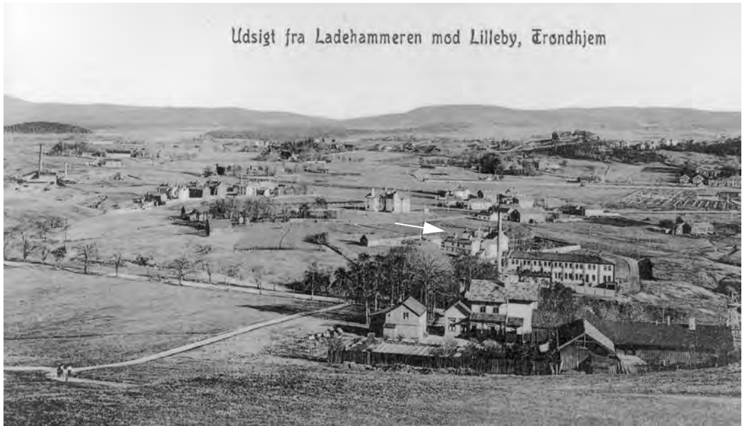
Postkort fra rundt 1910. Bygningen med pipe til høyre i bildet er Dampvaskeriet, etablert 1900. Fridheim ligger rett bak Dampvaskeriet. Kopi fra Universitetsbiblioteket i Trondheim.

med barnas klær - at de alltid blir holdt i stand. Bestyrerinnen har ansvar for at maten blir ordentlig tilberedt, servert presis, og at barna fra de er 12 år får anledning til å lære/praktisere kjøkken- og matstell. Bestyrerinnen kan gi barna tillatelse til å besøke foreldrene en gang annen hver måned. Ellers kan barna få besøk en gang i uken etter avtale med bestyrerinnen. Barna har ikke anledning til å være borte om natten.