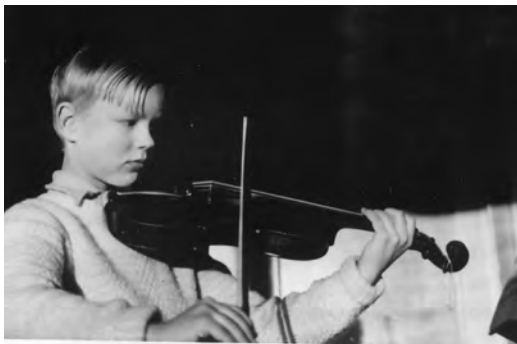
Konsentrert ung fiolinist.

Fredrik Skagen skriver i boken En by som ingen ainnen at det to dager etter 9.april oppsto rykter om at en større flåte var på vei inn fjorden, og en følelse av