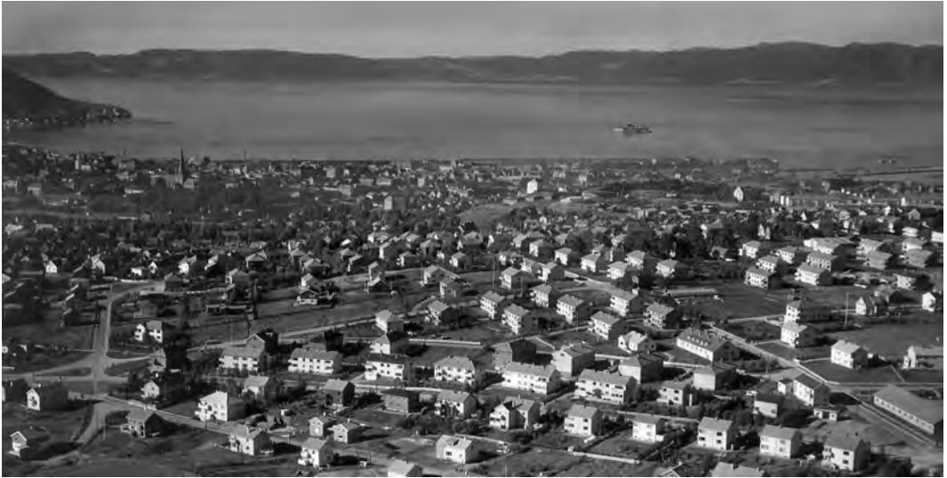
Flyfoto 1952. Foto Widerøes Flyveselskap. Kopi fra Universitetsbiblioteket i Trondheim.