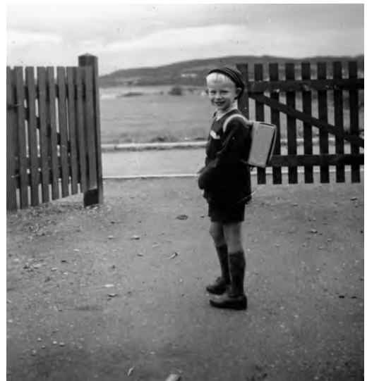
Første skoledag. Bildet er tatt ved porten til Harald Bothners veg 16. Åpne jorder så langt vi ser.

I vårt nærområde - Harald Bothners vei, Sigurd Slembes vei, Paul Fjermstads vei - "krydde" det av unger. Bare i nr.16 og de tre nærmeste firemannsboligene som var Harald Bothners vei nr.14, Sigurd