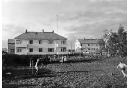
Fotballtrening i hagen vår i Harald Bothners veg 16.

”Herneshaven”, (vår nabogård med stor have), var et yndet sted for epleslang. Tidlig på våren gikk vi til og med på rabrabraslang der. Vi var nok ikke drevet til dette av sult, snarere spenning. Slan-geplene var som oftest ”gaillsure”.