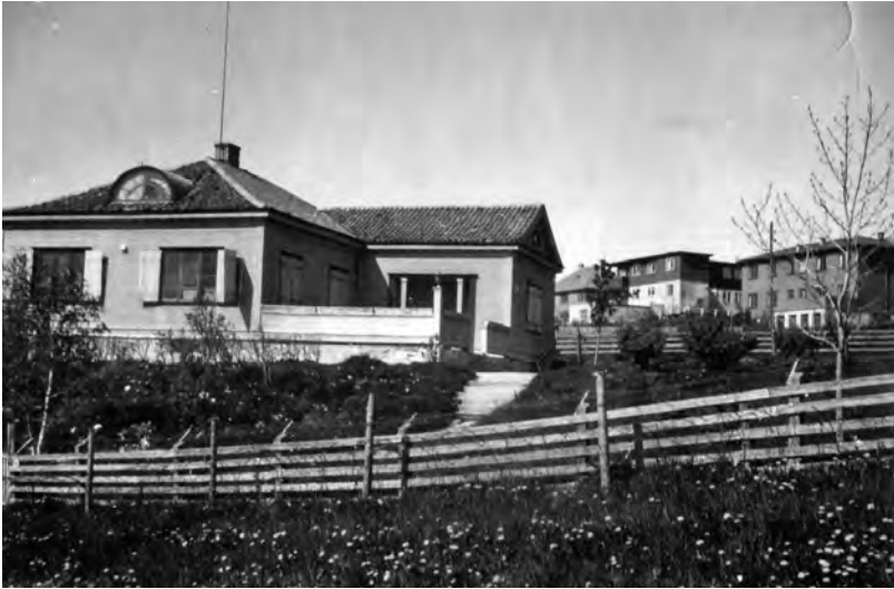
Bilde av artikkelforfatterens barnehage som senere ble Henry Rinnans "Bandekloster". Huset ligger i krysset Harald Bothners vei, Kong Inges gate og Jonsvannsveien.