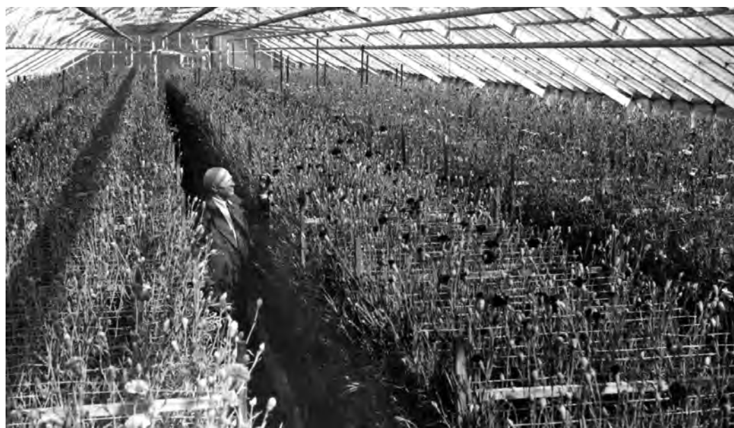
Iver Moum blant nelliker i et drivhus på Baldershage . Dette var den dominerende blomsterkulturen fra 1950-årene og fram til slutten av 1980-årene.