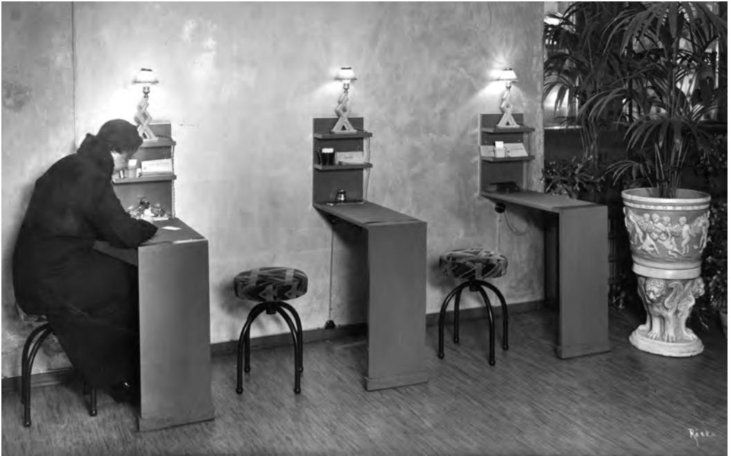
Fra butikken i Lysholmgården i 1935.