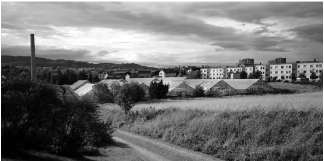
Gartneriet på Baldershage i 1992. Bak gartneriet ser vi blokker i Fernanda Nissens veg.

Det meste av produksjonen hadde vært omsatt engros, og markedsområde var Trøndelag og Nord-Norge helt opp til Finnmark. Mye ble sendt med Hurtigruta. Etter hvert som konkurrenter tok til å kjøre salgsruter med bil, og kommunikasjonene bedret seg, fikk en etter hvert problemer med salget. Fra 1976 ble derfor gartneriet medlem av Gartnerhallens blomsteravdeling.