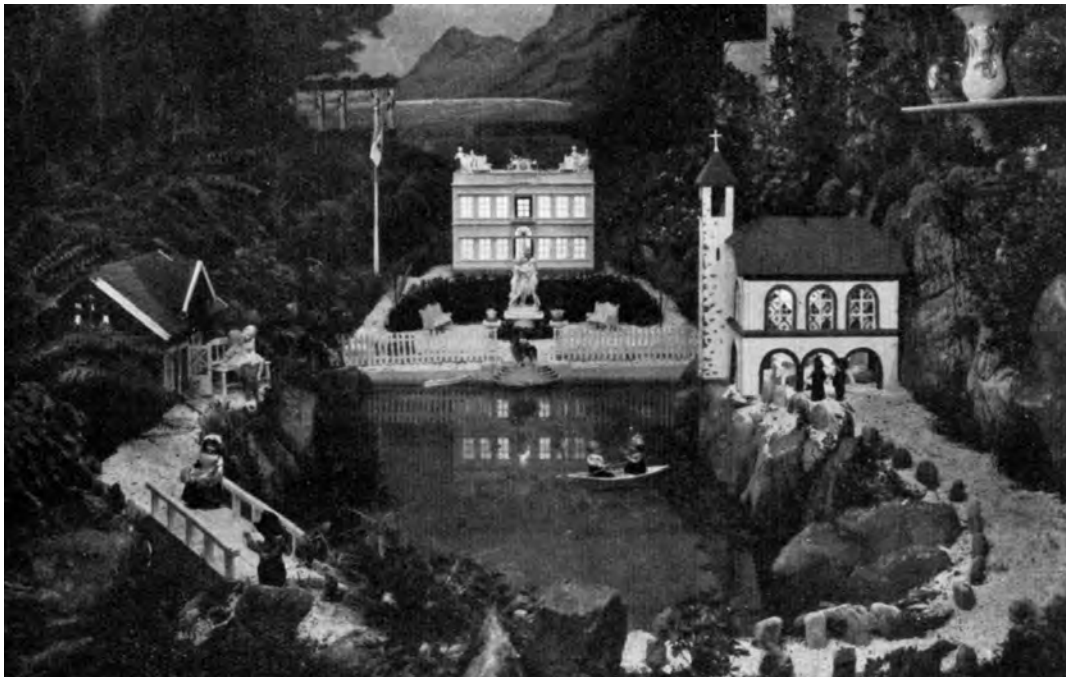
Moum hadde i mange år fram til 1939 flotte juleutstillinger i butikklokalet i forbindelse med tenningen av julegranen. Dette er utstillingen i 1930. Den viser Villa Charlotta ved Comosjøen i Italia.