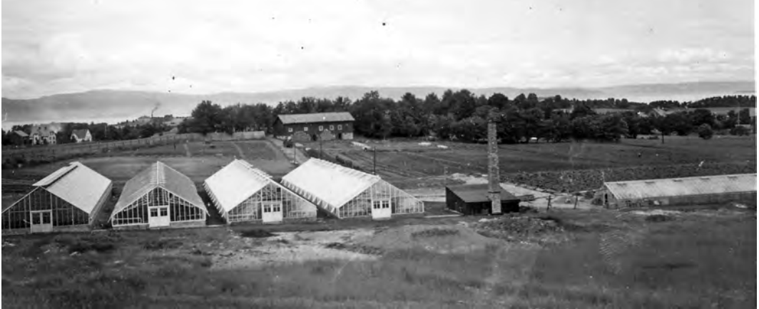
Gartneriet på Baldershage i 1936. Drivhusene dekket da et areal på 2260 m 2 . Bak gartneriet er fjøset på Baldershage.

gartneriet på Baldershage. Etter eksamen fra Statens Gartnerskole i Oslo i 1943 og praksis fra Franz Hegg i Lier og ved veksthusene på Landbrukshøgskolen på Ås, tok han fatt på drift og utbygging på Baldershage. Det var gode tider for næringen på 50-tallet og først på 60-tallet, og mye av overskuddet ble pløyd tilbake i bedriften i form av utbygging. Da det siste av tre meget store veksthus på 1.500 m 2 sto ferdig i 1966, var totalt areal under glass kommet opp i hele 15.000 m 2 ! Det var etter datidens målestokk et meget stort og moderne gartneri - det største nord for Dovre og landets 3. største.