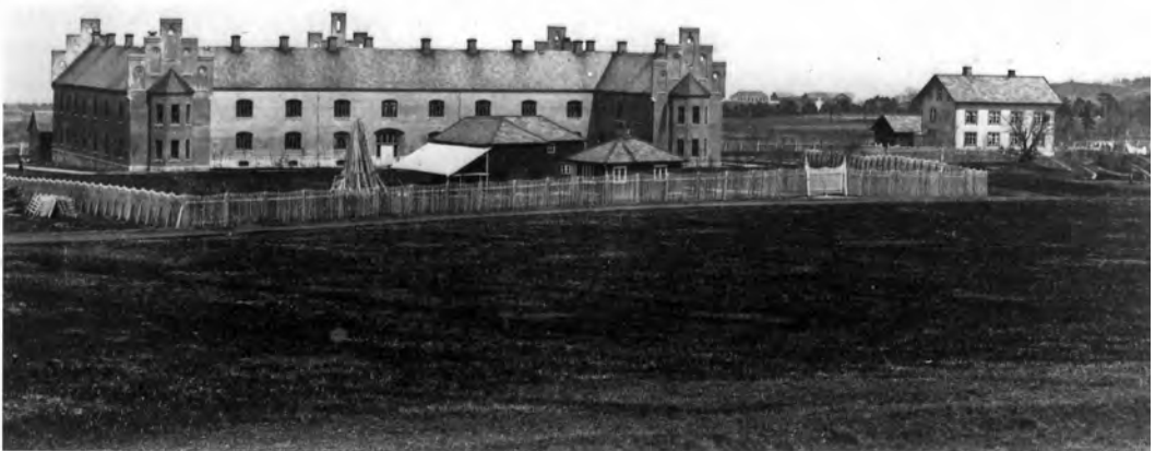
Reitgjerdet på 1870-tallet. Slik var sykehusanlegget til det ble ombygget til psykiatrisk sykehus.