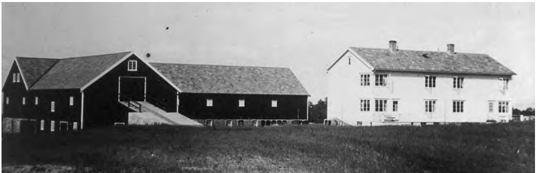
Gårdsbruket på Reitgjerdet - Brøset gård - i 1935. Gårdsanlegget ble gjenoppbygd på østsiden av Brøsetvegen etter brannen i 1931.

I den felles inngangen til leilighetene hang det en telefon på veggen som var koblet opp mot sentralbordet på Reitgjerdet sykehus, og som alle kunne be-