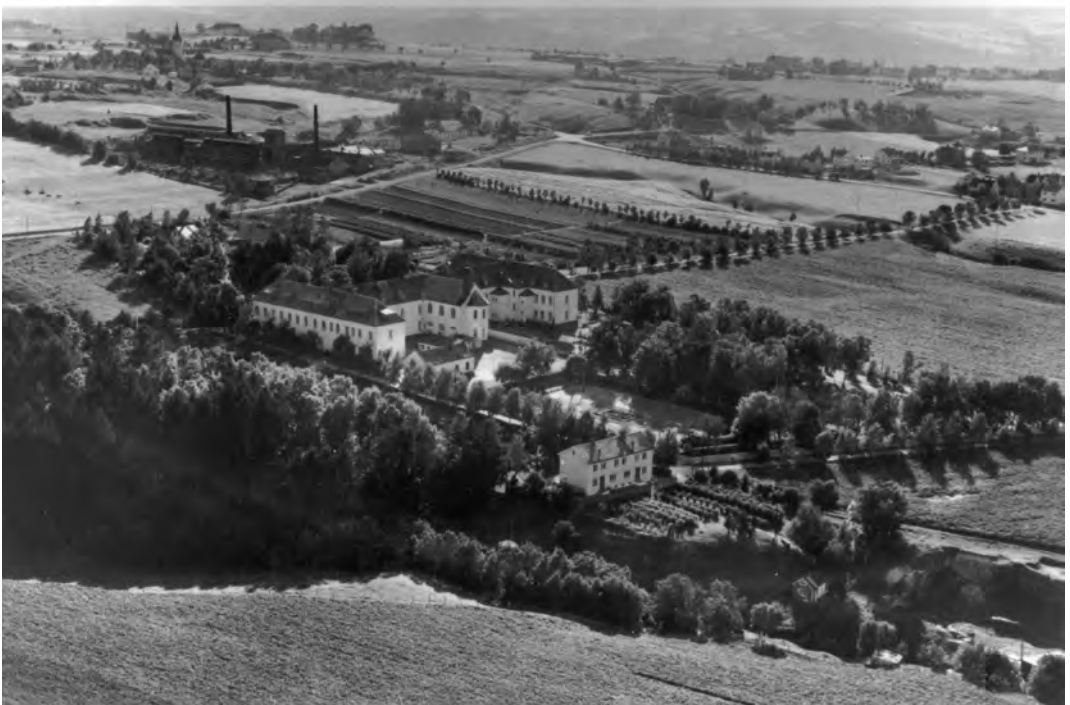
Mot vest i 1951.

Kriminalasylet på Kalvskinnet med 35 pasienter lå også under Reitgjerdets administrasjon. Det var ønske om å avvikle dette og flytte pasientene til Reitgjerdet. Kriminalasylet, som i 1895 ble opprettet som en midlertidig løsning for 50 pasienter, var både gammeldags og uegnet - og hadde vel alltid vært det. Ventelistene på Reitgjerdet var lange, og en overføring til Reitgjerdet var ikke mulig p.g.a. plassproblemen. Personalforeningen presset på for å få utvidet