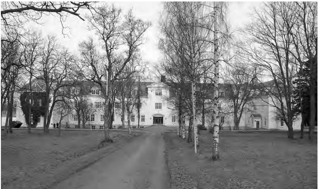
Mot hovedinngangen i mars 2004.

Så tidlig som i 1929 ble Reitgjerdet salongskytterlag stiftet. Skytingen drev man dels innendørs – i korridoren i 3. etasje i gammelbygget. Senere ble det opparbeidet en utendørsbane på Brøset. Skytterlaget ble oppløst like før krigen.