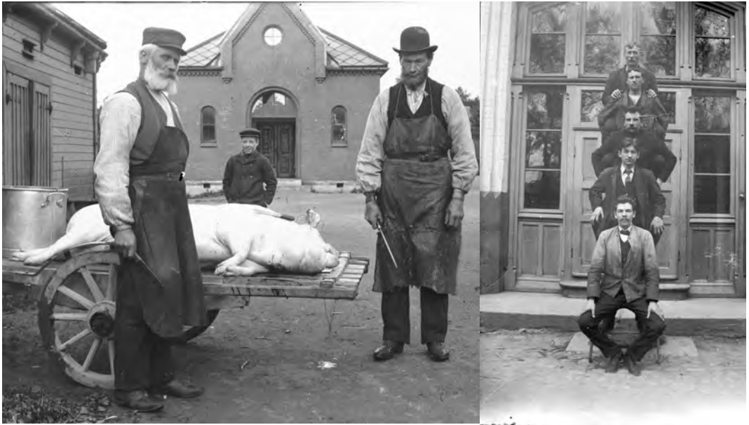
Bilder fra Reitgjerdet da det var spedalsksykehus.

Sannsynligvis var det økt renslighet som førte til at pasienttallet gikk nedover. 17. april 1914 besluttet Stortinget at Reitgjerdet pleiestiftelse for spedalske skulle nedlegges. Institusjonen ble for stor å holde i gang for et etter hvert lite pasienttall. I 1920 ble naboeiendommen Brøset, som lå på vestsiden av Brøsetveien, innkjøpt av Staten og innrettet til pleiehjem for de 19 pasientene (11 menn og 8 kvinner) som var igjen. De flyttet over til Brøset i februar 1921. Brøset pleiehjem for spedalske ble nedlagt 22. juli 1925, og de få pasientene som ennå var igjen, ble overført til pleiestiftelsen St. Jørgens hospital i Bergen.