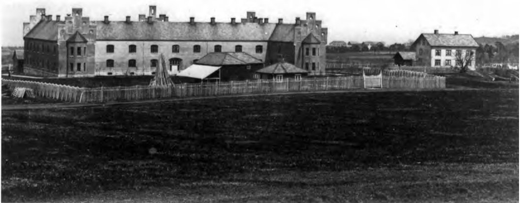
Reitgjerdet på 1870-tallet. Slik var sykehusanlegget til det ble ombygget til psykiatrisk sykehus.