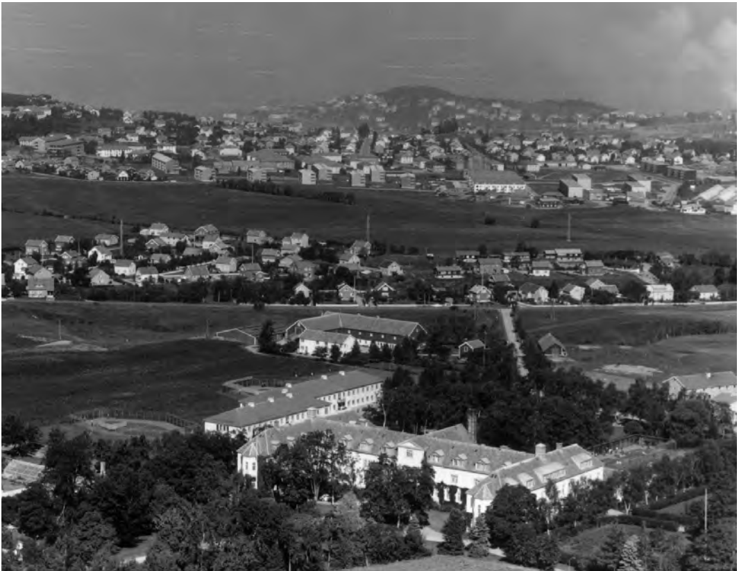
Flyfoto mot nord 5. august 1969. Legg merke til nybygget fra 1961 bak den gamle bygningen. Se også bildet fra 1936 på side 71.

http://www.ub.ntnu.no/formidl/hist/trobib