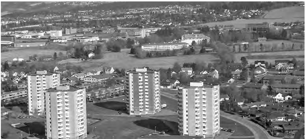
Reitgjerdet sett fra Tyholtttårnet i mai 2006.

Støren, W. K. Sted og navn i Trondheim. F. Bruns Bokhandels Forlag. Trondheim 1983.