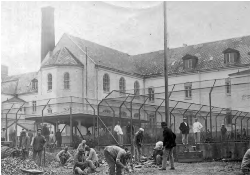
Steinarbeid i ytre luftegård. Stein fra steinbruddet knuses til pukk. Redskapet helt til venstre er sorterings-trommelen. Reitgjerdets kapell er i 2. etasje i utbygget.

I starten hadde sykehuset fire avdelinger delt etter hvor farlige pasientene var, pluss en tuberkuloseavdeling. Legene vurderte hvilken avdeling nye pasienter skulle plasseres i, og hvor egnet pasientene var til forskjellig arbeid og aktiviteter. Selv om mange pasienter kom til Reitgjerdet fra andre sykehus, kjente heller ikke legene alle pasientene så godt at dette kunne være en enkel opp-