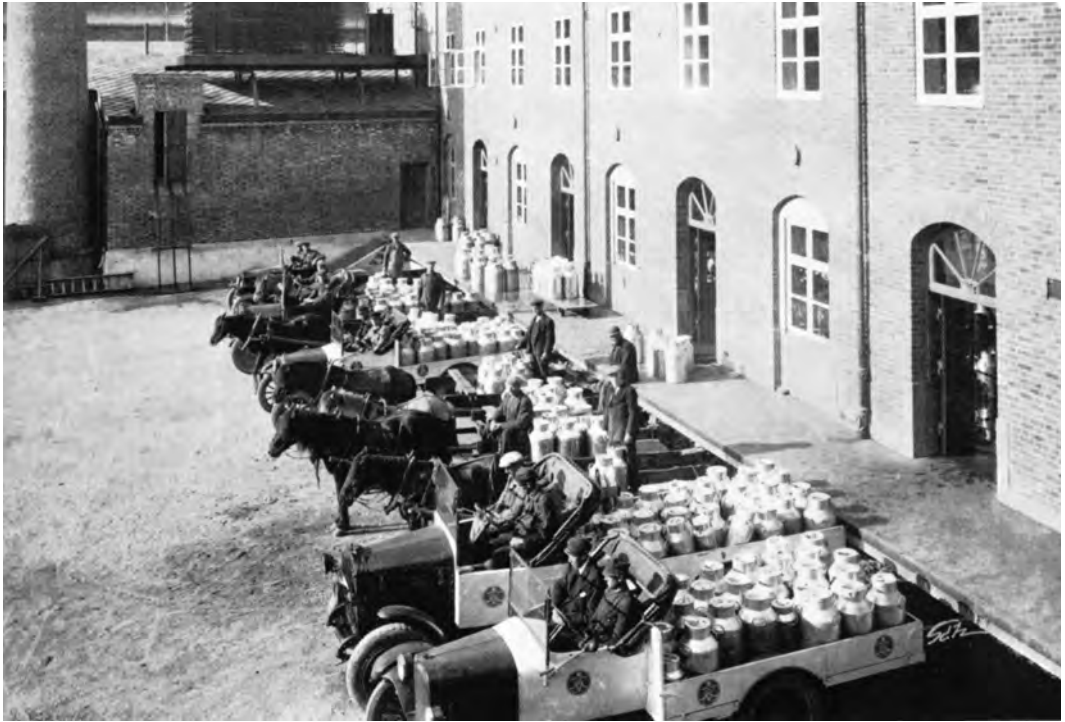
Fra ekspedisjonsrampen ved Trondhjems Melkforsyning i 1920-årene. Fra boka Melkeomsetningen i Trondheim gjennom 100 år .

Meieri og Leinstrand Meieri. Til å begynne med gikk fellesdriften bra, men da det til stadighet ble opprettet nye melkesalgsmeierier rundt Trondheim, oppsto det vanskeligheter med salget, og samarbeidet opphørte. Bare i 1883-84 kom det 11 nye meierier på markedet i Trondheim. Dette førte til dårligere priser og misnøye.*