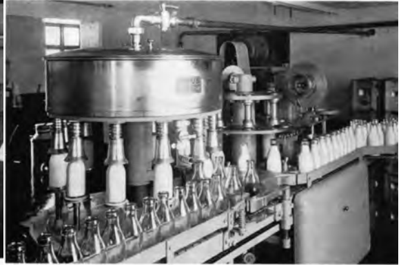
Tappemaskin for flaskemelk på Trondhjems Melkforsyning.

Fra boka Melkeomsetningen i Trondheim gjennom 100 år .