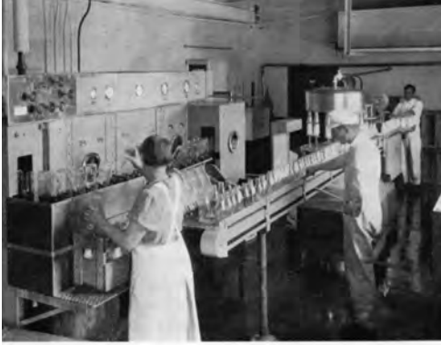
Interiør Trondhjems Melkforsyning. Flaskemelkanlegg fra 1930-årene.