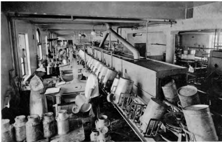
Mottakingshallen på Buran etter modernisering i 1951.

I Trøndermeieriets tid skjedde det store endringer på mange områder. Ved starten var det vanlig at produsentene selv