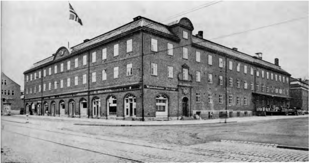
Det store meieranlegget på Buran. Her startet Trondhjems Melkforsyning i 1925. Rampen til høyre er fra nyere tid. Trøndermeieriet overtok anlegget i 1948 og utvidet det ved et tilbygg mot gårdsplassen.

Fra boka Melkeomsetningen i Trondheim gjennom 100 år .