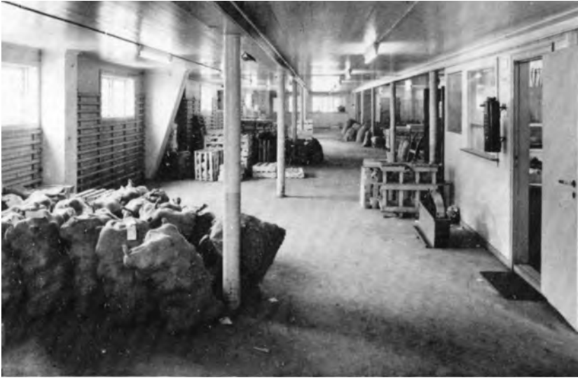
Lagerekspedisjonen i Sandgata 12. Bilde fra A/L Gartnerhallen. Trøndelag distrikt. 30-årsberetning. 1976.

kontorer og sosiale rom var også på plass i bygget. Disse nye lokalene muliggjorde økt virksomhet.