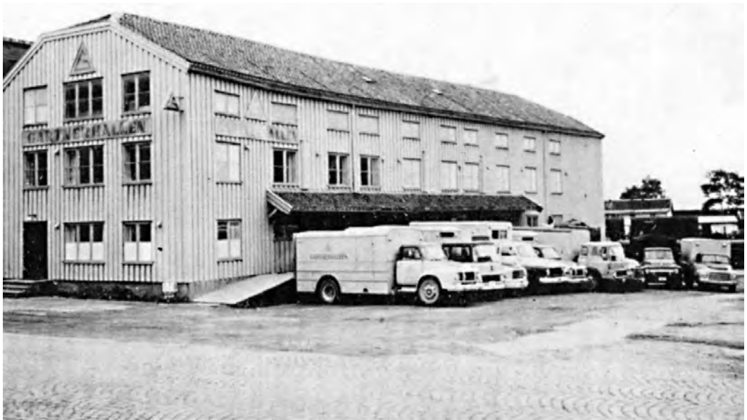
Sandgt. 12. Solgt 1965. Bilde fra A/L Gartnerhallen. Trøndelag distrikt. 30-årsberetning. 1976.

I 1950 gikk Gartnerhallens hovedkontor til innkjøp av Sandgata 12. Etter vel ett år med ombygging, flyttet Trondheimsavdelinga fra den trange og mørke kjelleren på Frostakaia til et velinnreda lagerhus, med romslige og hensiktsmessige lager- og ekspedisjonslokaler, kjølerom, vareheis og lasterampe. Seinere ble det også bygd til kai, som gjennom mange år ble et viktig og rasjonelt hjelpemiddel ved sjøveis vareinntak. Nye