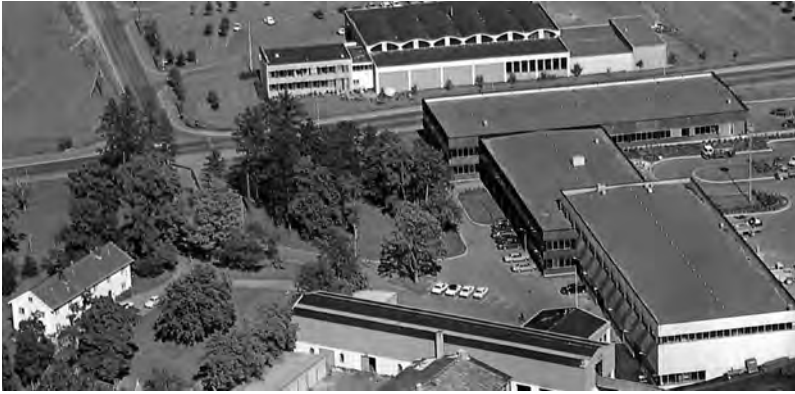
Gartnerhallen er øverst i bildet, og er nabo til Felleskjøpet. Bilde fra Felleskjøpet i Trondheim. 75 år i landbrukets tjeneste utgitt i 1975.

arbeid om bedriftslege og med BS om snørydding og plenklipping. I 30-årsberetninga til Gartnerhallen Trøndelag i 1976 kan vi lese: ”Det kan ikke være tvil om at trøndersk landbruk og trønderske bønder og gartnere med så vel store som små arealer på litt sikt ville vært tjent med et nærmere samarbeid mellom de økonomiske og faglige organisasjonene” .