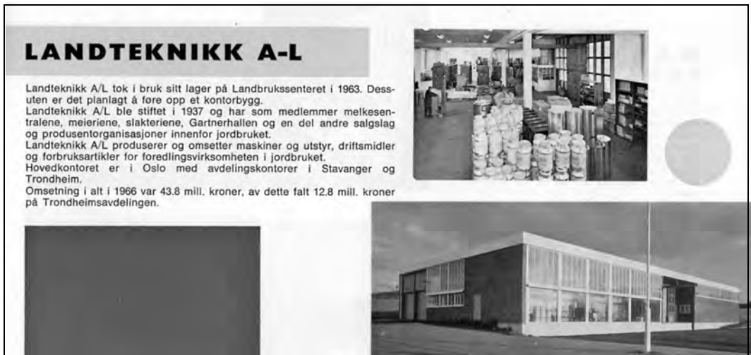
En side fra brosjyre om Landbrukscenteret i 1967.

Alt i starten ble det stilt tomt til disposisjon for Direktoratet for Jakt, Viltstell og Ferskvannsfiske. Her etablerte Direktoratet for naturforvaltning (DN) seg med nybygg høsten 1984, men på grunn av behov for større lokaler flyttet DN over til nybygde lokaler på nabotomta vinteren 1998, hvor de fortsatt er lokalisert.