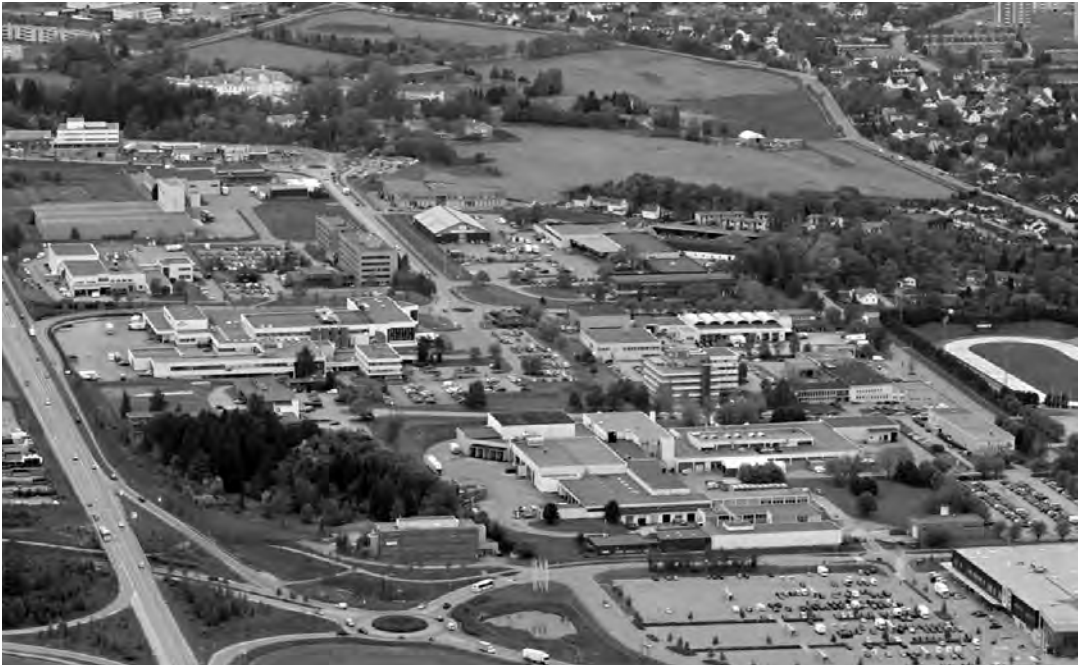
Landbrukssenteret i mai 2006. Mellom Diplom-Is og Felleskjøpet ser vi kontorbyggene til Direktoratet for naturforvaltning (DN) og Norsk institutt for naturforskning (NINA). I forgrunnen til høyre ser vi IKEA og bakerst tidligere Reitgjerdet sykehus.