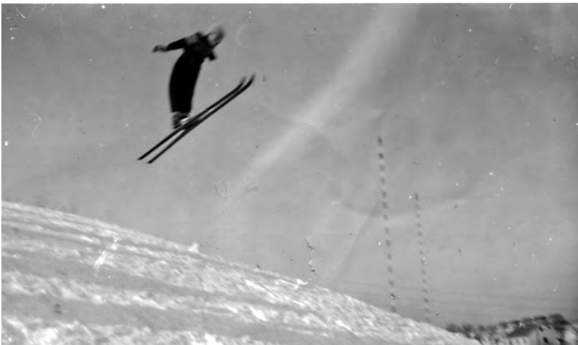
Bekkvolldalen. Et bilde av meg i "svevet" i 1957 - 13 1/2 år gammel. Jeg prøvde å nå 25-metermerket, men er litt bakpå. Radiomastene på Tyholt og Valentinlyst i bakgrunnen.

En periode gikk jeg sågar på Kongsberg hopp ski og kandaharbinding til skolen, dvs. fra Brøsetflata og til Åsvang skole. Med fyk-lakk under hopp skiene var det en stri tur på attglatte ski over jordene bak Teglverket. Det var brunost, lever-