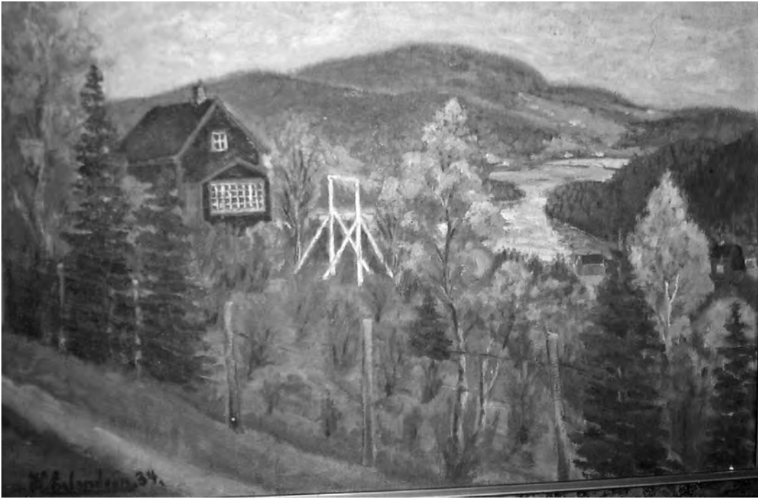
Sellanrå - maleri av H. Erlandsen fra 1934.

art, sikkert en uimotståelig fristelse for mange. Likedan friheten til å bygge den hytta som de mente ville passe seg selv og sin familie best - både når det gjaldt størrelse og utforming - var nok også med på å lette valget for den enkelte. Her var det ikke trangen til å imponere naboer, venner og andre skuelystne med det største og dyreste hyttepalasset som lå til grunn for hytteplanene. Det var nok i første rekke gleden av endelig å få noe som en kunne kalle sitt eget, og samtidig tilfredstilletsen av å kunne gi sine barn et fullverdig sommeropphold i trivelige og sunnere omgivelser enn i byens trange bakgårder og andre lite barnevennlige byrom.