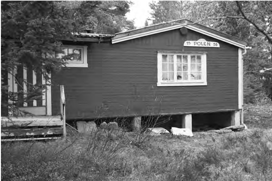
Hytta "Polen" fra 1926.

dre gårdeiere enn Vassæter og Bækken. Røstadbakken som hyttefelt er navnemessig inndelt i tre felt. Vest for gården heter det Jogjerdet. Dette strekker seg helt frem til inngangen til Styggdalen og turløypa Kleiva, som stuper bratt ned fra Nymånen i Strindamarka. Området er oppkalt etter en Jo som skal ha bodd her en gang i tiden.