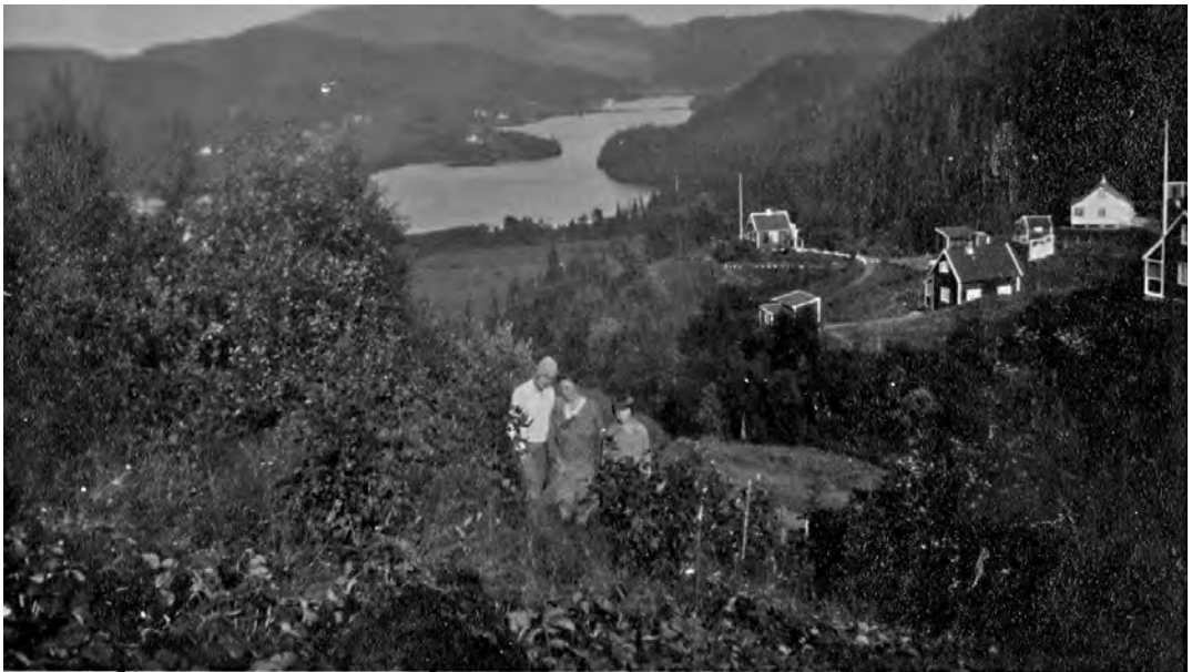
Utsikt mot Jonsvatnet fra Sellanrå sommeren 1929. Den nybygde Solbakken bro skimtes i bakgrunnen.

Offentlig renovasjon var et ukjent begrep på den tiden, men dette bød ikke på problemer for Røstadbakken-folket i det hele tatt. De store tomtene, som den enkelte hytteeier disponerte til eget bruk, viste seg å være ideelle til nettopp renovasjon. Det som ble produsert i lillehuset med hjerte på døra, og den minimale