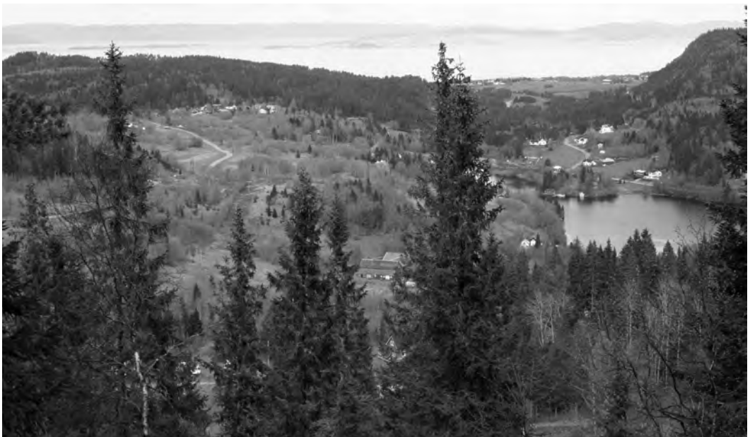
Utsikt fra Fløyen i mai 2007.

Hvordan var det å være barn og ungdom på den tiden, i dette relativt avsidesliggende hyttesamfunnet, som manglet nesten alle de fasiliteter som i dag rek-