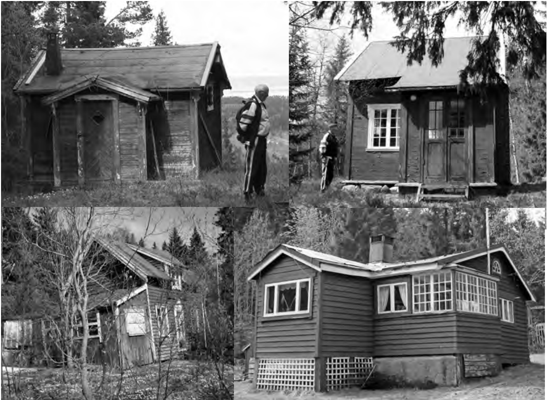
Hytter på Røstadbakken i mai 2007. Øverst til venstre er Fløyen. Ingen hytter av 2007-størrelse! Vi ser artikkelforfatteren på de 2 øverste bildene.

veien til Røstadbakken tar av fra Osbakken, åpnet en fru Koen et sommerutsalg for melk og brød. Ikke så langt fra der veien opp til Øvre Vikeraunet tar av fra Røstadbakkveien, lå et lite hvitmalt koselig hus. Her åpnet en fru Røme en liten kolonialbutikk, som eksisterte til like før andre verdenskrig. Røstadbakken-folket hadde dermed hele fire butikker å velge mellom, mens de i dag må dra enten ned til Jakobsli eller Vikåsfeltet, hvis de skal handle i "nærmiljøet." Den såkalte byutviklingen kan derfor for mange likeså godt føles som en "byavvikling".