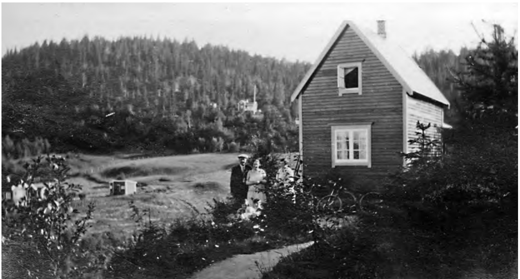
Sellanrå fotografert fra nord engang på 1920-tallet.