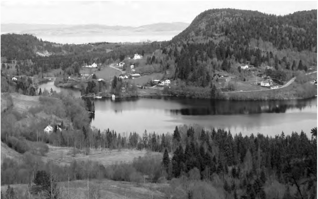
Utsikt mot Litjvatnet og Osen i mai 2007.

Det ble også dannet en hytteforening, som organiserte fellesdugnader for å forbedre veisystemet. Denne foreningen