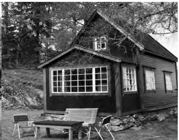
Sellanrå i mai 2007 - under oppussing.