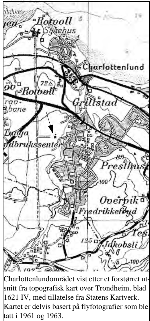
Charlottenlundområdet vist etter et forstørret utsnitt fra topografisk kart over Trondheim, blad 1621 IV, med tillatelse fra Statens Kartverk. Kartet er delvis basert på flyfotografier som ble tatt i 1961 og 1963.

Nå var det derfor viktig at man snarest kom i gang med en ny skole på Charlottenlund. Jon Berg foreslo at skoleanlegget ble bygd i 2 etapper, og at ungdomsskolen, med sine krav til spesialrom, skulle stå ferdig til høsten 1964. Da ville de første ordinære ungdomsskoleklassene starte med 7. trinn og leg-