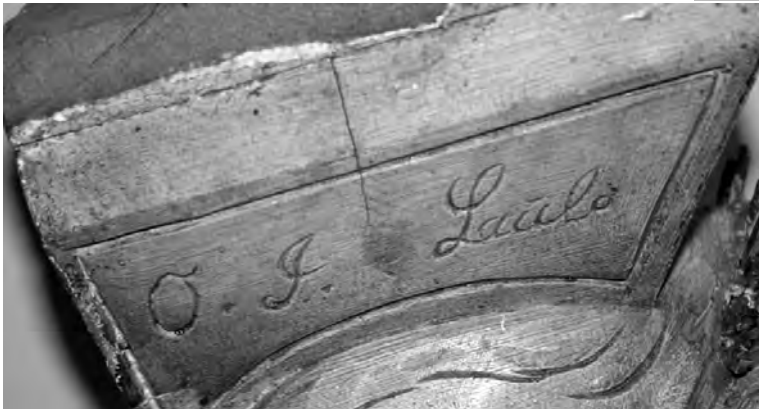
Laulo har risset inn navnet sitt på kvinnehodet øverst til høyre. Eier av de avbildede figurene er Steinar Vidvei.