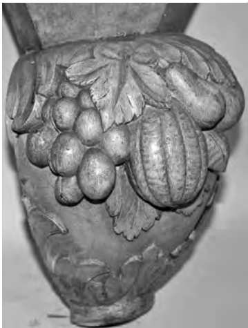
En av amforaene