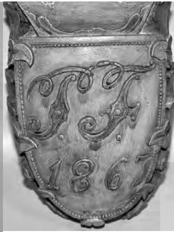
“Skjoldet” forfra og fra siden