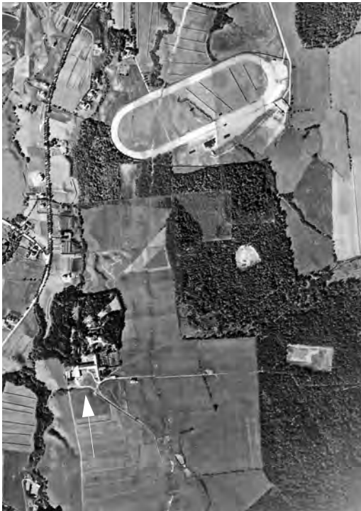
Utsnitt av flyfoto fra før 1940. Pilen peker på Tungen gård. Legg merke til hvor mye som da var skogkledd. De to åpne områdene i skogen er dammene Finnsjø og Furusjø. Se kartet.