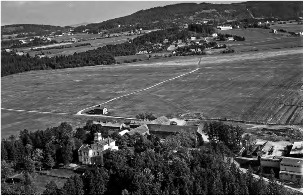
Tungen gård i juli 1958 mot øst. Over jordet går en gårdsveg fram til den påbegynte Omkjøringsvegen. Grasmelfabrikken brukte denne som kjøreveg fram til Granåsvegen ved Angelltrøa. Granåsen gård ser vi øverst til høyre.