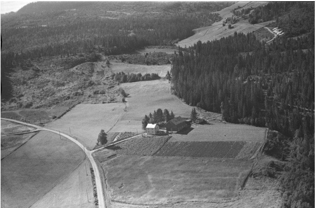
Flyfoto av gården Haugum 24. august 1958. Ny Jord-samlingen med Quisling på besøk fant sted bak husene. Gården i bakgrunnen er Movollen.