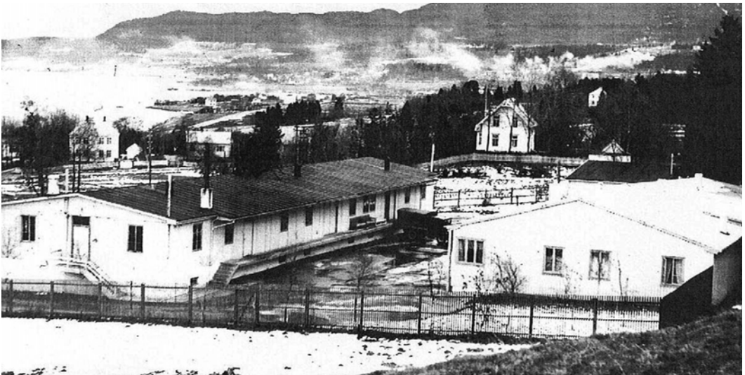
Tyskerbrakker i Ranheimsvegen 75 på Charlottenlund. Under krigen brukt av organisasjonen Todt. Produksjonslokaler for Gaute Næringsindustri AS fra 1947 – 2002. I dag finner en der nyoppførte boliger med husnummer 63 til 75.

Den 18. oktober 1964 var det russisk flåtebesøk i Trondheim, og da ble det fore-