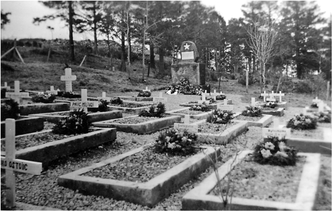
Bilde av krigsgravene på St. Hanshugen tatt etter seremonien 21. juli 1945.

østsiden av St. Hanshaugen var det ved krigens slutt gravlagt 30 sovjetrussiske rødegardister og 13 jugoslaviske partisanmenn. De var alle ofre for den tyske fascismen.