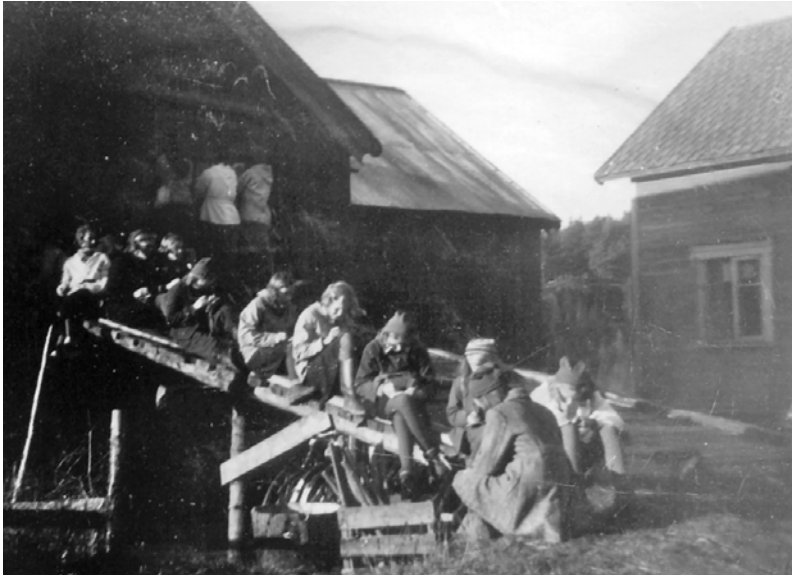
Speiderjenter i aktivitet på låvebrua til Bekken gård.

innenfor gjerdet, for Estenstaddammene var den gangen en del av Strindas drikkevann. Dessuten var damvokteren som bodde på Tømmerholt, streng, så vi jentene våget aldri å gå innom gjerdet. Likevel hørte vi at enkelte både hadde fisket og badet i Estenstaddammene. Tidligere var det en speiderslette ved Endreplassen også, hvor det var tilsvarende aktiviteter, men der var det plantet små granbusker. Nå er det en bred sti der med et skilt.