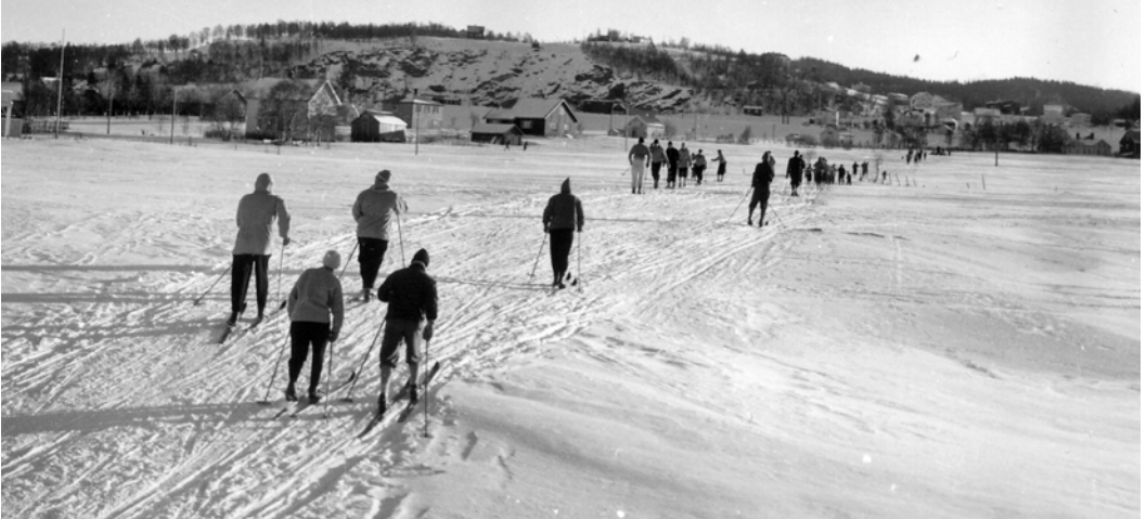
På tur til Estenstadmarka i 1956. Øverst i bakgrunnen er tyskerbrakker ved Lidarende. Nederst er Veiskillet til venstre og Bergheim steinbrudd bakerst midt i bildet.

hadde egne hoppski. Vi andre hadde bare ett par ski. De skulle brukes til all skigåing, både “bortover”, slalåm og utfor. De fleste hadde Kandaharbindinger. Det var en wire som gikk rundt skohælen. Foran var wiren festet i en klemme. På siden av skisålen var det et par kroker på begge sider der vi kunne feste wiren. Dette gjorde at skoene ble klemt godt ned mot skisålen, og vi fikk god styring