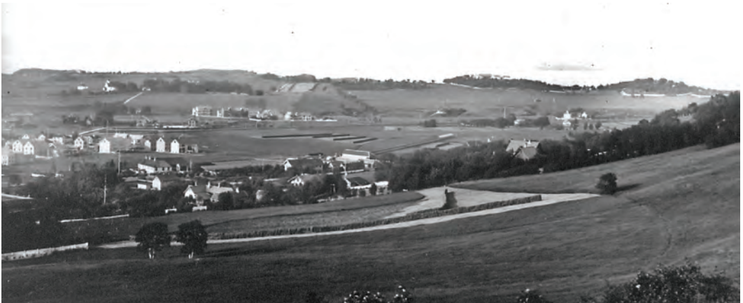
Utsikt fra “Litjkuhaugen” over Bakkaunet mot Lade i 1892. I bakgrunnen ser vi Lade kirke til venstre og Ringve og Devle til høyre. Bakkaunet gård er helt til venstre.