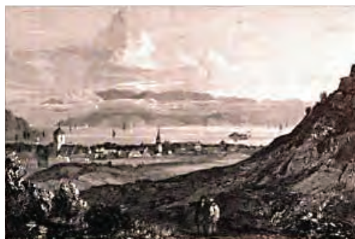
Sir Thomas Aclands prospekt fra Trondheim. Utsikt fra området ved Lillegården. Fra "Google bøker".

Nogle faa Ord om Munkholmen og Domkirken afslutter Skildringen af Trondhjem, hvoraf der i Bogen findes et meget godt Prospekt, taget omtrent fra Lillegaarden og tegnet som alle de øvrige Billeder av Sir Thomas Acland.