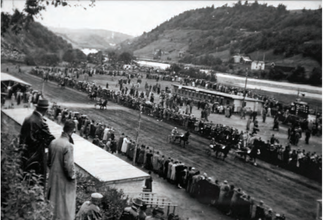
Travkjøring på Tempebanen under krigen på grunn av at tyskerne annekterte Leangen. Svært mye folk og høye omsetningstall på den banen som senere skulle bli hjemmearena for fotballklubben Nidelv, som ble opprettet da idrettslagene Tempe og Nidarvold slo seg sammen.

magre år. Senere kom tyske okkuperanter og beslagla hele området. I noen krigsår ble Tempebanen en kjærkommen reservearena. Her ble det satt nye omsetningsrekorder. Under krigen var det som kjent lite å bruke pengene på, dermed satt de litt løsere hos travpublikumet. Men når først Leangen Travbane ble satt i stand igjen, følte det nærmest som å komme hjem, ifølge veteranene som fulgte sporten den gangen. Og veteraner skal en som kjent tro på - de har i hvertfall sammenlikningsgrunnlaget.