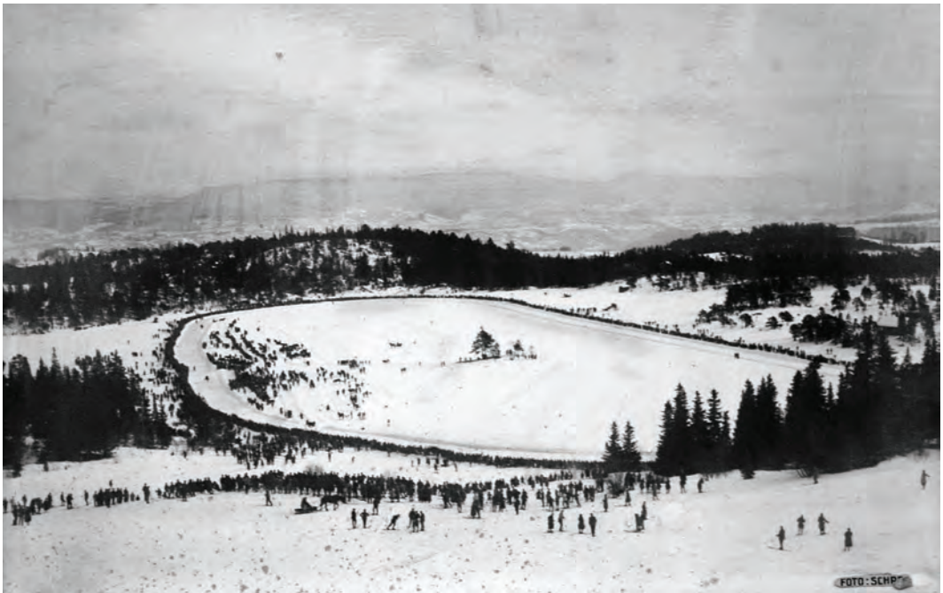
Iskjøring på Lianvannet 1. mars 1925. Intet totalisatorløp med tillatt spill, men rett og slett hestintresse samlet tusenvis av mennesker.

Fra 1925 ble Lianvannet arena for travløpene i en del år. Flere ganger kranset 5 – 6000 mennesker arenaen. I 1927 ble TT tilbudt gratis travbanetomt på Lian-