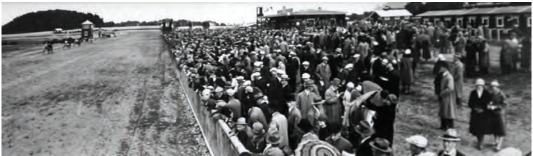
Tidlig etterkrigsår på Leangen med mye mer folk enn på vanlige travdager i 2009. Deler av indre bane ble bortleid i mange år til fotballkretsen - som avviklet fotball i aldersbestemte klasser. Det sier litt om mangelen på fotballbaner på 1950-tallet.

Pionérene som anla Leangen Travbane, måtte utover 30-tallet finne seg i en del