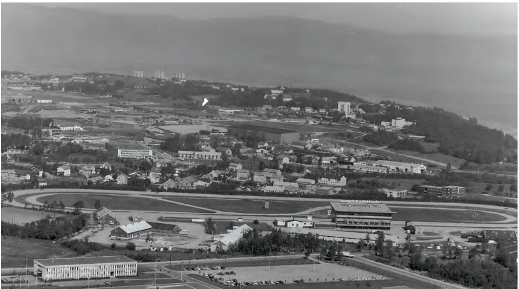
Flyfoto fra 1969. Leangens første store tribune er bygd. Legg merke til treningsløypene på indre baner. I forgrunnen vises litt av Bøndernes Salgslags anlegg på Landbrukssenteret på Tunga. Flyfoto tatt av Widerøes flyveselskap i 1969. Kopi fra Universitetsbiblioteket i Trondheim.

1990-åra ble en gyllen æra for trønderske hester. Varmblodstraverne Tamin Sandy og Shan Rags dominerte sporten. De vant storløp både i Italia og i Frankrike. Bork Rigel fra Vanvikan var tilsvarende overlegen på kaldblodssida. Disse tre stjernene ga alltid små odds når de startet, men hadde utrolig mange