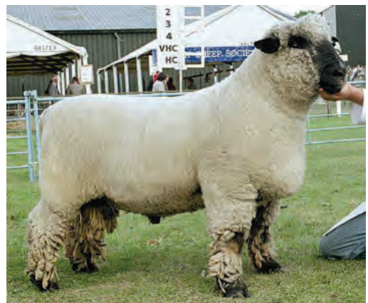
Sauerasen Oxford Down.