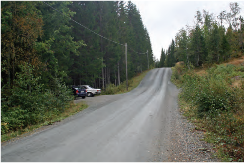
Dette bildet viser ploghusplassen i dag. Huset sto omtrent der den lyse bilen er parkert - med langsiden langs veien.

eller politi. Verken plog eller ploghus ble utsatt for hærverk, og det var vel dette som fikk myndighetene til å se gjennom fingrene med vår selvtækt.