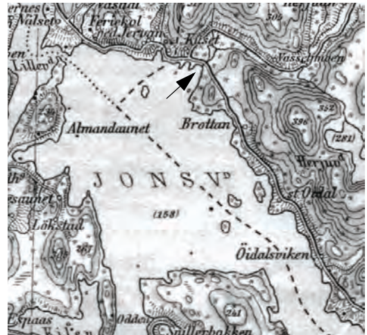
Pilen viser hvor ploghuset var - ikke langt fra vegkrysset hvor vegen til Malvik starter. Utsnitt av "Typografisk kart over Norge. Blad 46D. Revidert 1927".

I 1943 var det jo utenkelig at politiet ville gi tillatelse til noen form for sammenkomster av ikke-nazister, i det alt slikt var strengt forbudt. De som eventuelt trosset dette forbudet, risikerte strenge straffer. Forbudet ble for øvrig kraftig skjerpet etter tragedien ved Stalingrad. Men den omtalte lørdagskvelden i juni 1943 var vi fast bestemt på å trosse alle på- og forbud, for de de siste meldingene Toralv Øksnevad sendte oss fra London, ga tydelige signaler om at den tyske krigslykken var i ferd med å snu, og at Hitlers nederlag ved Stalingrad innvarslet et dramatisk vendepunkt i krigens gang. Vi tok derfor sjansen på at selv tyskerne måtte begripe at deres tid snart var over, og at de derfor ville rea-