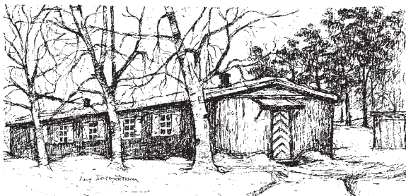
KLUBBHUSET VED BROMSTAD Tegnet av Leif Kolbjørnsen.