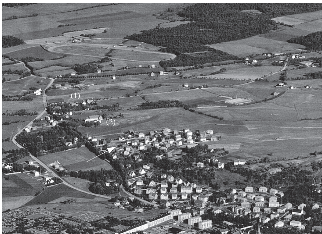
Strindheimområdet i 1936. Utsnitt fra flyfoto tatt av Widerøes Flyveselskap. Marienberg er høyden merket med hvit pil. Vi ser også Strindheim skole (1) og Pineberg gård (2). Kopi fra Universitetsbiblioteket i Trondheim.

samme gjaldt friidrettsgutta. Transporten foregikk vanligvis pr. lastebil, men noen av friidrettsgutta benyttet en gammel grønn Ford med kallenavnet “Den grønne pimpernell”. Sjåfør var Hallvard Vinje. Klubben var stadig i vekst, og økonomien var bra, så alt så lyst ut. Men så kom april 1940 og krigen som stoppet all aktivitet.