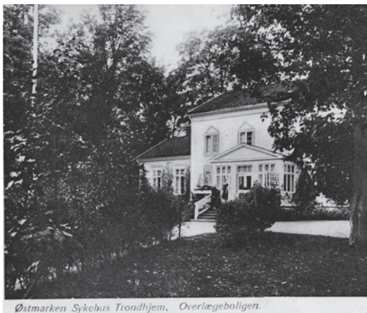
Hovedbygningen på Spandet. Til venstre - bygningen på Hjalmar Olsens tid. Til høyre - som overlegebolig. Bildet til venstre: Foto: Hans Krum. Kopi fra Universitetsbiblioteket i Trondheim. Til høyre: Postkort utlånt av Jon Kvistedal.

eide Spandet fra 1852–65 etter å ha hatt stedet på bygsel i noen år. Han rev de opprinnelige bygningene og bygde nye, da han skulle ha stedet til landsted. Da hospitalet overtok, ble hovedbygningen omgjort til direktørbolig og senere brukt til undervisning og administrasjon.