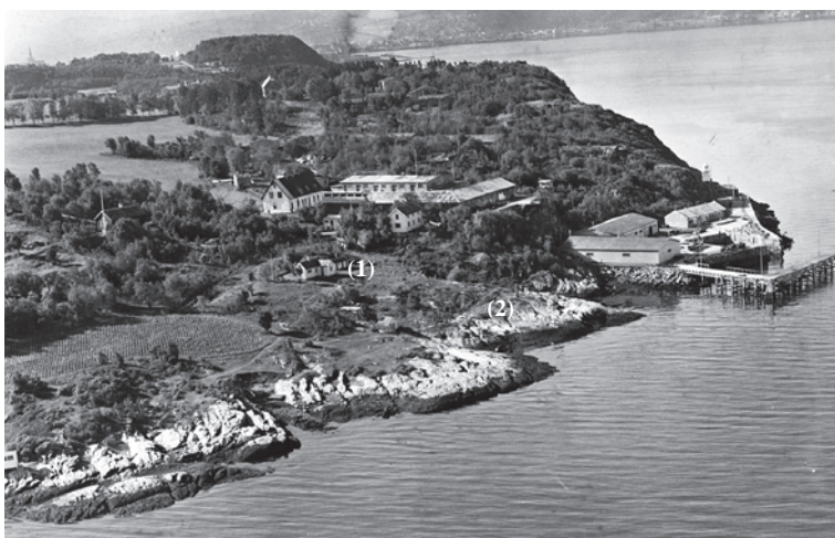
Østmarkneset i 1947 og støtta over Peter og Elen Lie. Nedre Festberget er midt i bildet (1), og støtta står på neset merket med (2). På bildet fra 1947 ser vi også alléen til Østmarken gård øverst.