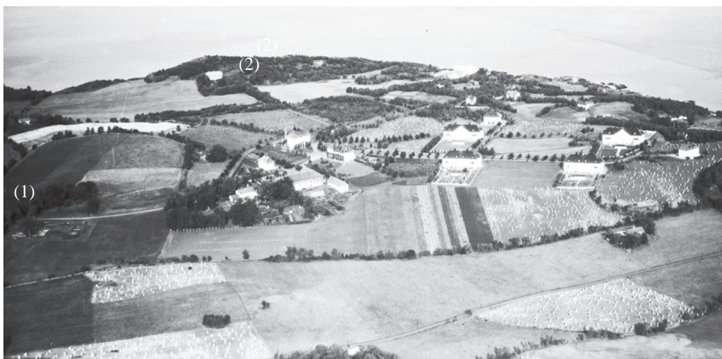
Ladelandskapet i 1936. Midt i bildet: Østmarken sykehus (gården Spandet). I venstre kant vises trærne ved Moen gård (1). Østmarken gård lå bakerst i bildet (2).

I 1845 overtok krigsråd Knut Holtermann Lade. I hans tid ble de første gårdsparseller solgt, nemlig gårdene