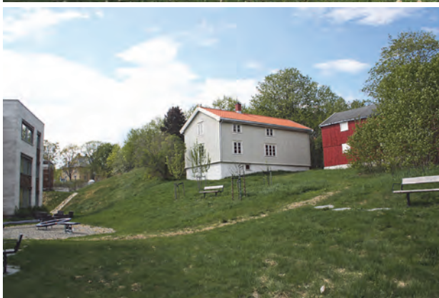
Husmannsplassene under Spandet. Øverst: Bilde fra ca. 1930. Nøstet er nede ved sjøen og Kysten oppe til venstre. I midten: Trærne til venstre er fra hagen til Tindveden. Husene lå på sletta i forgrunnen. Til høyre ser vi Ladestien. Nederst: Haugen. Eiendommen eies av St. Olavs hospital, som har restaurert den utvendig. Til venstre skimtes Nidaros DPS (Distriktpsikiatrisk senter) - et nybygg fra 2009. Det øverste bildet er utlånt av Gunnar Hagen.