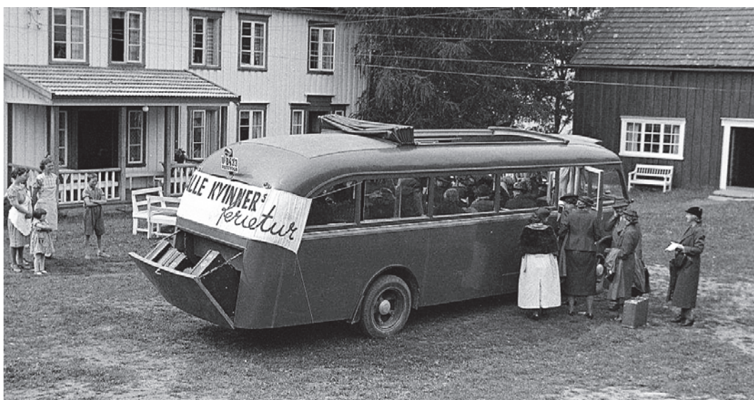
U-8433 som turbuss. Bladet Alle Kvinners ferietur til Haugum gård på Inderøy i juli 1939.

Melbye følte vel nå et visst press. Før 39-sesongen skriver han: «Prisen på buss kan jeg ikke slå av på, men for drosje skal jeg kjøre for kr. 8.00. Dette er rimelige priser, da det jo er tur/retur og passasjerer, flyvere og gods skal hentes på forskjellige steder.» Dermed ender dette kapitlet i Jonsvannsrutas historie. Så kom krigen, og etter frigjøringen ble Trondheims sjøflyhavn flyttet til Hommelvik i 1947, etter en «mellomlanding» i Ilsvika - og Jonsvannet ved dårlig vær.