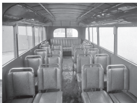
Chevrolet 1937 halvbulldog var en nyskapning det året. Eksteriør og interiør.

ke sider. En gir rask orientering om Trondheim, Nidarosdomen og havna. I Hommelvik nevnes den tyske damperen (en krysser) «Berlin» og interneringen av dens mannskap under (første) verdenskrigen. Naturlig nok ble et stedsnavn lenger nord utnyttet for alt det var verdt: