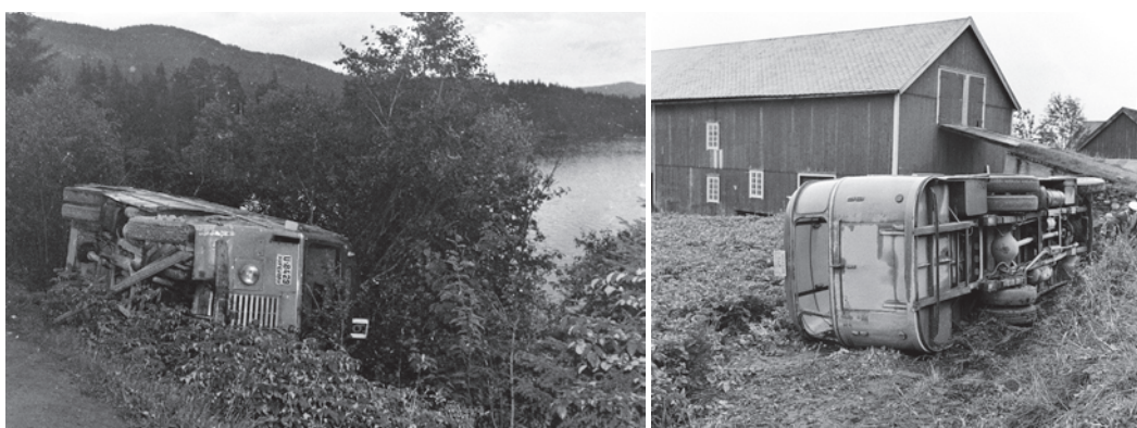
Hendelser ved Jonsvannet i 1950-årene - hvor Schrøders fotografer var til stede. Til venstre: 7. september 1952, til høyre: 15. august 1958.

En annen gang skulle vi ha med familiens 4 sykler og mye bagasje. Da var også bussen temmelig full. Ikke bare var den full, sykkelstativet foran i grillen og bagasjerommet bak var også fullt! Faderens forslag om å legge syklene oppe på taket (må antagelig ha vært bagasjegrind der), ble av-