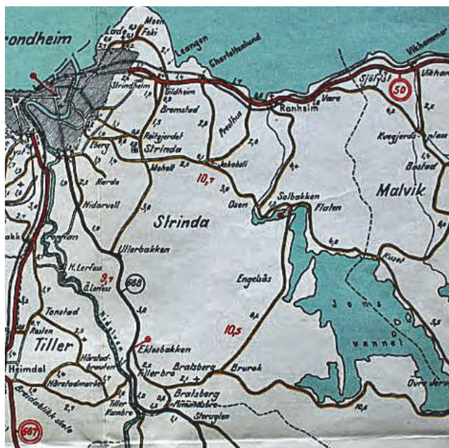
Fra Veikart over Sør-Trøndelag fylke, 1933. Utsnitt av detaljkart over herredene Strinda, Tiller, Leinstrand og Byneset.