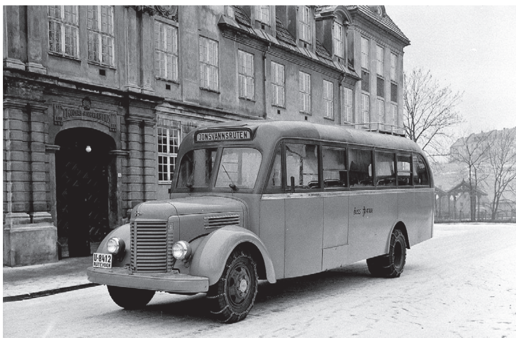
Nybygd International snutebuss til Jonsvannsruta i 1947, med karosseri fra Johs. Olsens Vognfabrikk i Strandveien 7a. Logoen til sammenslutningen A/S Busstrafikk på siden. Legg merke til styrkjettingen. Arkitekt Guldahls nybarokke fasade på Thomas Angells hus var favorittbakgrunn når det skulle tas leveransfoto for bilbransjen.

men driftsunderskudd. Passasjertallet var sunket med 40 %, men transportkapasiteten var vesentlig bedre utnyttet, eller sagt på en annen måte: Det ble trangere på bussen – og færre avganger. Driftsregnskap og status for 1943 viser 300 driftsdager, og at antallet vogner var redusert til tre: En Mercedes-Benz 1940-modell med 28 seter, og to International 1938 med hhv. 24 og 10 seter, den siste var en kombinert person-/godsvogn. En Volvo anskaffet i 1940 var i mellomtiden blitt solgt.