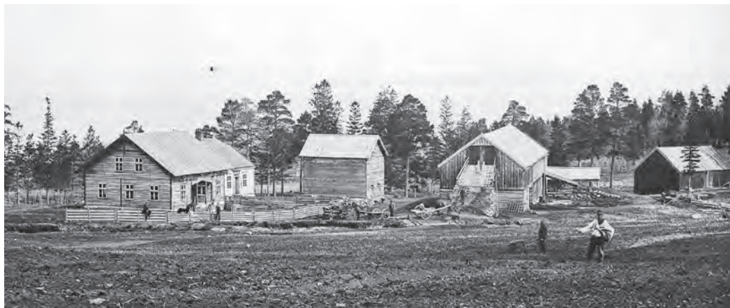
Skovgård ca. 1870.