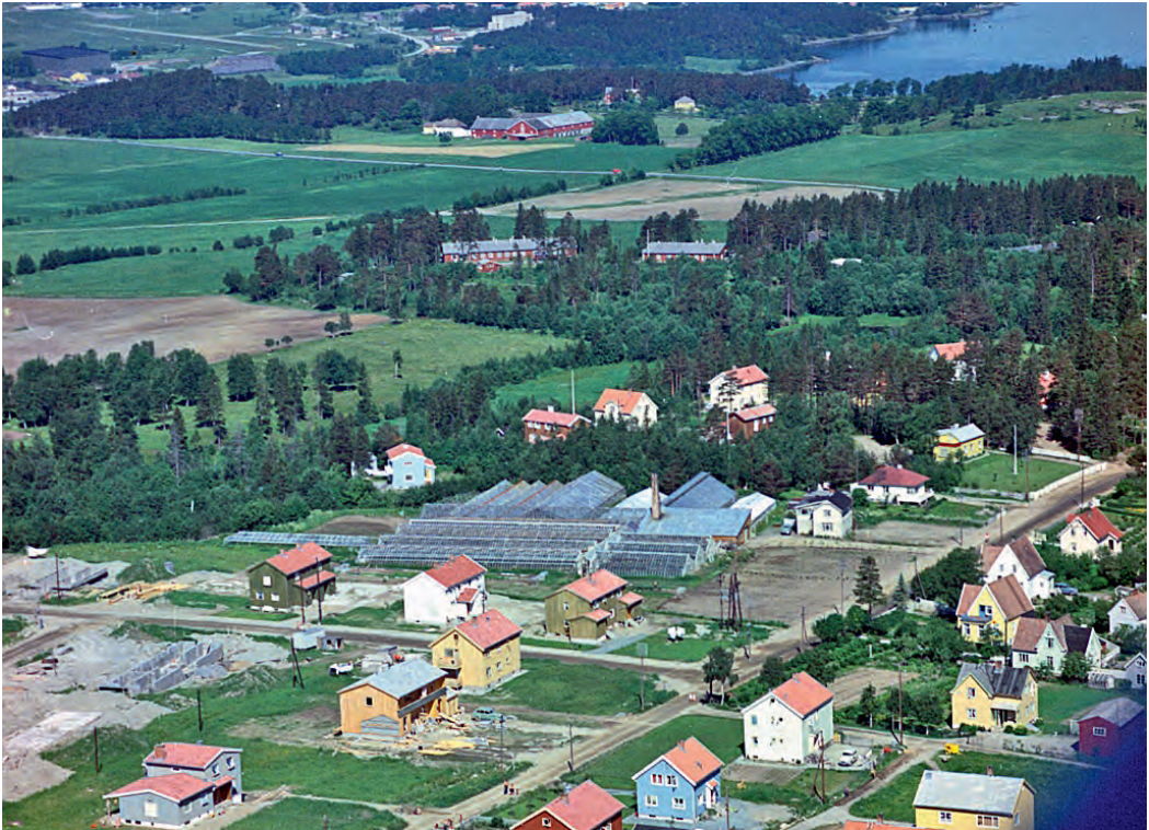
Foto fra 1960. Vi ser gartneriet Furumoen midt i bildet. Jakobslivegen går gjennom bildet.