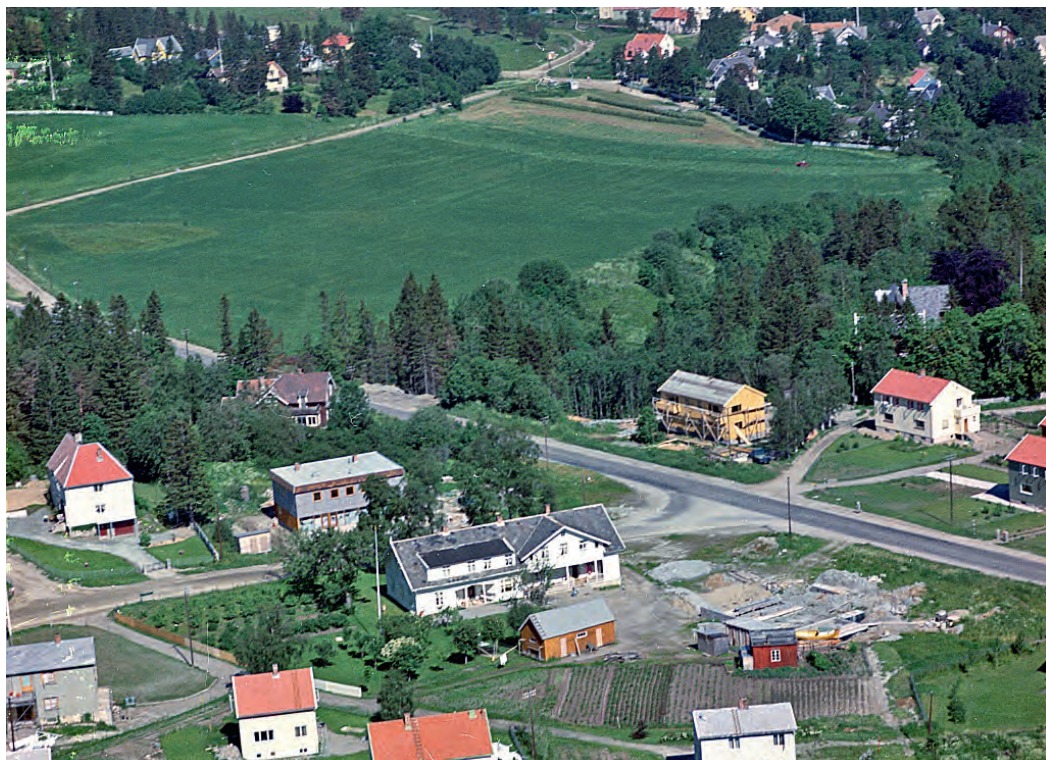
Skovgård og Skovgårdkrysset midt i bildet i 1960.

tilbrakte flere sommerferier på gården. Han etablerte en stiftelse, der midlene bl.a. kunne gå til forskjønnelse av parkområdet på Leangen gård. Den første parken forfalt etter at Trondheim kommune overtok gården i 1963. Den grodde igjen etter noen år, og stiftelsen stilte midler til disposisjon for renovering av parken. Arbeidet ble fullført i 1988, og resultatet ble svært bra.