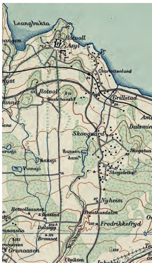
Utsnitt av kartblad Trondheim og omegn, blad 4, 1937.

Faren hans døde i ung alder, noe som førte til at familien måtte selge gartneriet, og de kjøpte hus i Oldervegen 2.