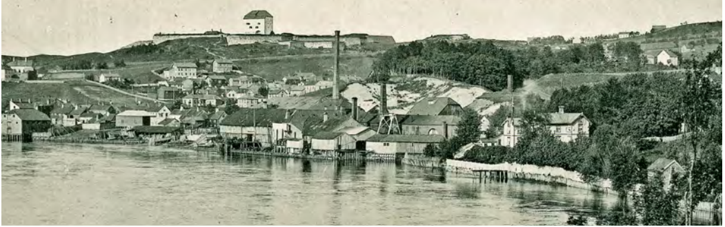
Området nedenfor Elgesæter bru. Eiendommen «Luna» til høyre som nærmeste nabo til Trondhjems Jernindustri. Trondhjems Aktieteglverk, Duedalen og Kristiansten i bakgrunnen. Fra bildemappen «Trondhjem og omegn, Ill. af Wilhelm Dreesen Hoffotograf», utg. av Holbæk Erichsens forlag, Trondheim, ved byens 900-års jubileum 1897.