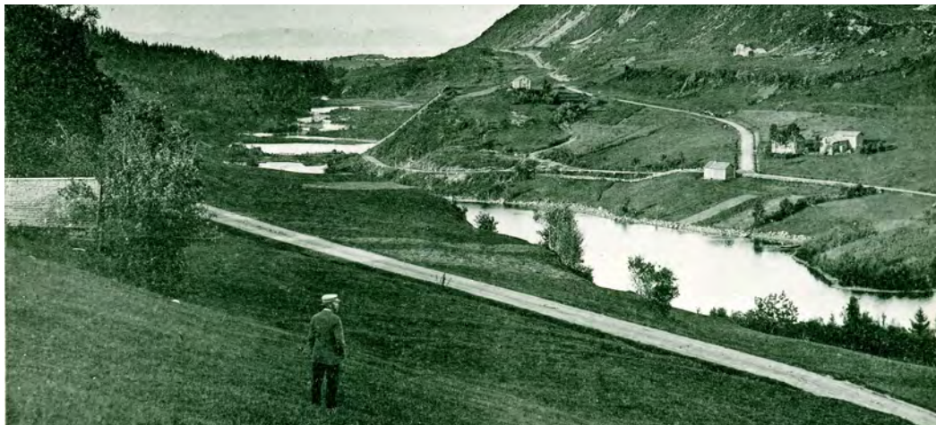
Området ved Osen og Litjvatnet i 1896. Eiendommen Sæter (Rotbukten) ligger til høyre i bildet. I forgrunnen sees vegen på vestsiden av Jonsvatnet før Solbakken bru kom i 1927.