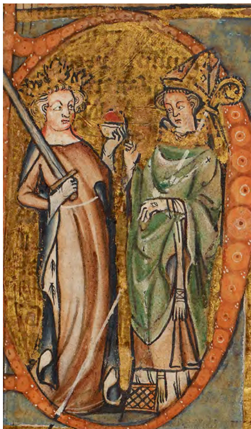
Også kristendomsbolken innledes med initialen B, som viser en konge og en biskop med sine respektive myndighetstegn, sverdet og staven. Fra Codex Hardenbergianus.

En viktig side ved hirdloven var innføringen av skriftlighet i rettsliv og forvaltning, både lokalt og sentralt. Dette ble ytterligere utvidet