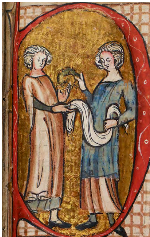
Kjøpebolken starter som de fleste bolkene med P, og inne i initialen ser vi en situasjon hvor det trolig dreier seg om handel med tekstiler. Her fra Codex Hardenbergianus.

hadde vært styrt av egne fyrster, og de hadde hatt sine egne lover og samfunnsordninger. Den norske kongen hadde med andre ord bare hatt et formelt overherredømme over disse landene, og nå og da mottatt tributt fra sine underordnede jarler og konger. Flere av orknøyjarlene og kongene på Man og Suderøyene (Hebridene) har dessuten sverget troskap også til engelske og skotske konger. Jarlene på Orknøyene holdt den nordligste delen av det skotske fastlandet, Caithness (gno. Katanes), under den skotske kronen. Det var imidlertid bare en formalitet ettersom jarlene fram til midten av 1200-tallet styr-