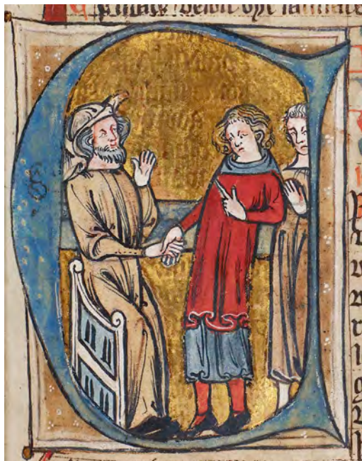
Landleiebølken, som innledes med initialen E, viser jordeieren som håndtas med leilendingen ved inngåelsen av leieavtalen. Fra Codex Hardenbergianus. Foto: Det Kgl. Bibliotek, København, GKS 1154 fol.

som handler om kirkehold, og kristen sed og skikk, og som vi finner i de eldre lov-bøkene, var som nevnt overlatt til erkebiskopen i 1269. Landevernsbølken handler om forsvaret, særlig kystforsvaret (leidangen). Mannhelgebølken dreier seg om drap og annen voldskriminalitet, mens økonomisk kriminalitet behandles i Tjuvebølken. Landbrigden handler mest om odel og arveskifte, mens Landleiebølken regulerer leieforhold mellom jordeier og leilending. Kjøpebølken rommer kontraktsretten og bestemmelser om gjeld, samt behandlingen av økonomiske tvistemål. De avsluttende retterbøtene dreier seg om noen enkeltlover fra Håkon Håkonssons og Magnus Lagabøte, som det ikke er funnet plass til i de øvrige bøkene. Også Landsloven inneholder bestemmelser