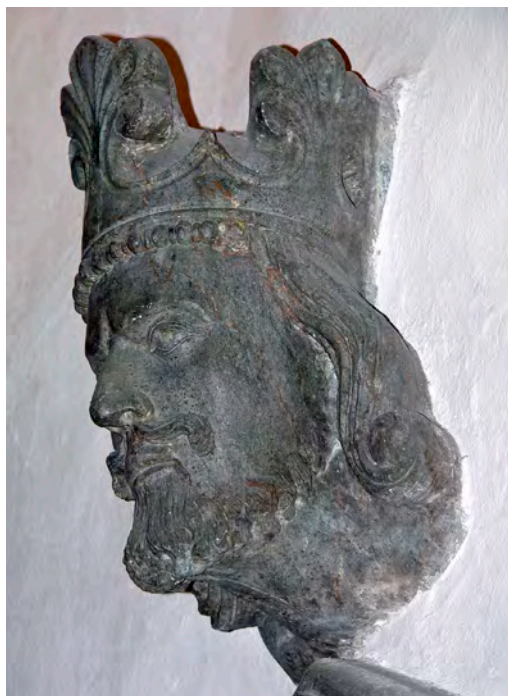
Kongehode fra den gotiske delen av Stavanger Domkirke, som ble bygd etter brannen i 1272. Man har antatt at det dreier seg om Magnus Lagabøte (født 1. mai 1238 - død 9. mai 1280).

Sommeren 1275 fór kong Magnus fra Bergen til Nidaros og med ham dronninga og