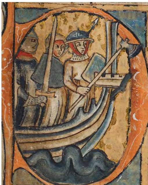
Initialen til Landevernsbolken viser et leidangskip med krigsfolk. Bilderammen er begynnerbokstaven Þ i denne bolken: Þ(at) er upphaf at landuarnar belki... (Det er opphavet til landevernsbolken...) Fra Codex Hardenbergianus.