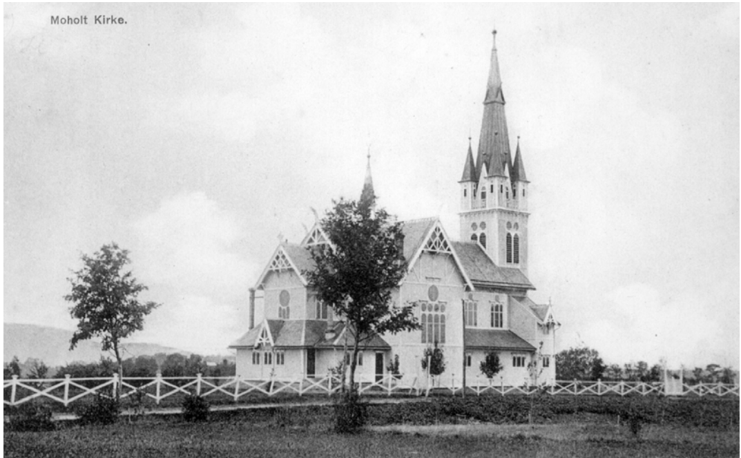
Strinda (Moholt) kyrkje rundt 1910.