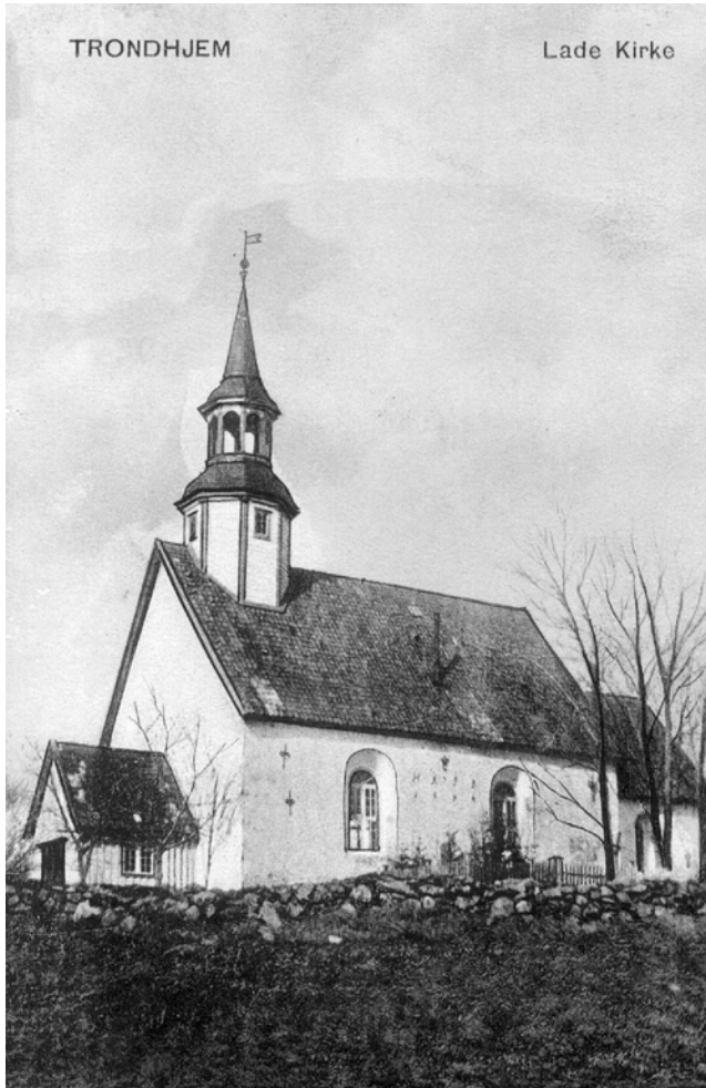
Lade kyrkje i 1906 Prospektkort utgjeve av A/S Peter Alstrups kunstforlag, Kristiania

i 1892. Då miste Strinda Rosenborg, Voldsminne, Rønningsletta, Singsaker, Vollabakken, Valan og Øya.