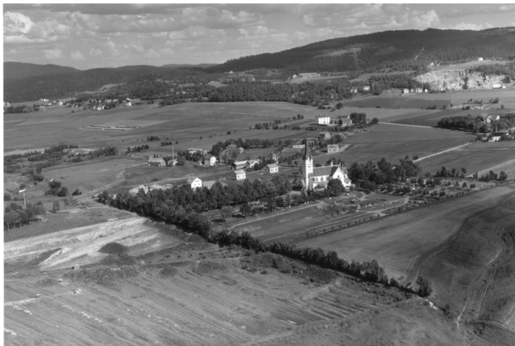
Fotografert av Widerøes flyselskap 8. august 1952. Kopi frå Universitetsbiblioteket i Trondheim