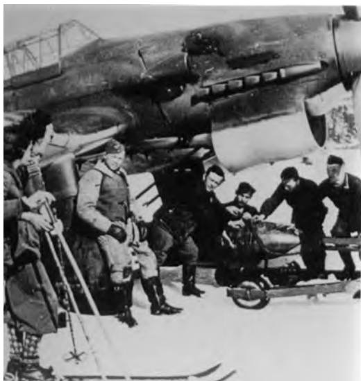
En Junker Ju-87 Stuka. Flymannskapet får besøk av et par lokale damer på ski. Dette var jo spennende! Stuka var et av krigens mest berømte fly, og et fryktet stupbombefly.

land. Men jeg har enda, som 80 åring, klare erindringer om hva jeg opplevde den 9. april for 62 år siden og i de påfølgende 5 år før våre “gjester” fant det for godt å forlate oss. Vi savnet dem ikke.