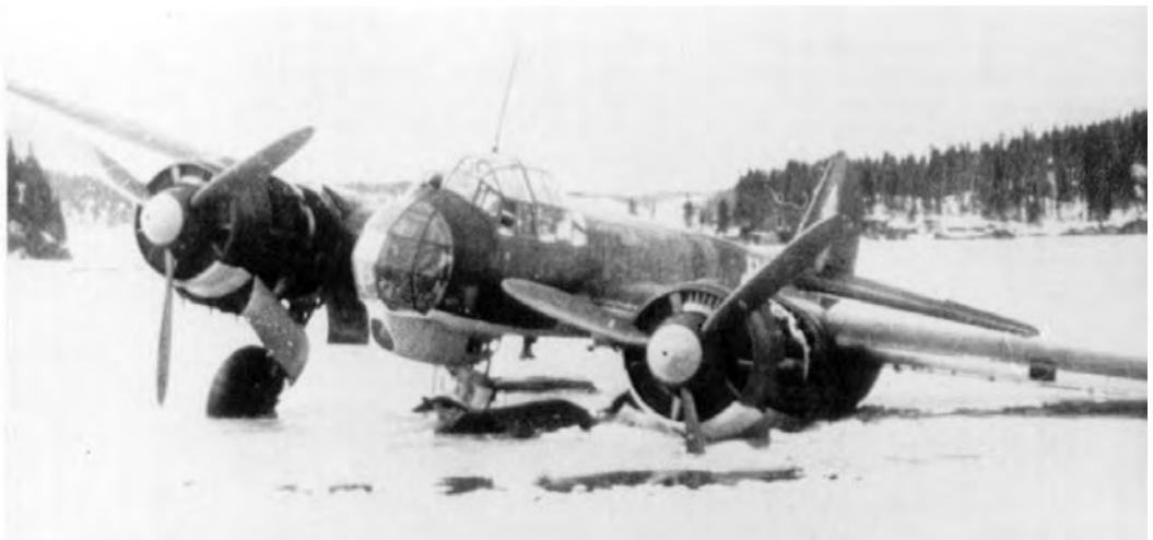
Junker Ju-88 A-1 med kjennermerke 4D+TK fra 2./Kampfgeschwader 30 i ferd med å gå gjennom isen etter at mildværet satte inn. Flyet ligger på bunnen den dag i dag, i meget god stand.

Etter det franske angrepet var det stille noen døgn. Men så en natt hørte vi flyddur fra høytgående tunge bombefly. Jeg fikk raskt på meg noe klær og gikk ut på gårdsplassen for å se hva som nå kom til å skje. Plutselig ble hele himmelen over Jonsvatnet opplyst av en magnesium-