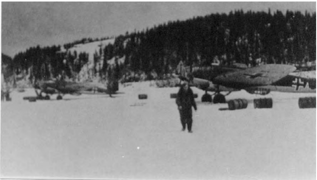
To Heinkel He 111 på Jonsvannet i april 1940. Dette var Luftwaffes mest anvendte bombefly.

Jeg var 17 år da den tyske krigsmakt innledet sitt besøk i vårt kjære fedre-