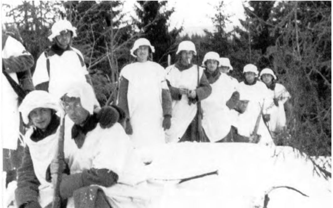
Tyske vaktmannskaper på sjøflyhavna i april 1940.

På Engelåshaugen anla tyskerne et lyskasteranlegg, og en stor mannskapsbrakke ble satt opp. Gjennom hele