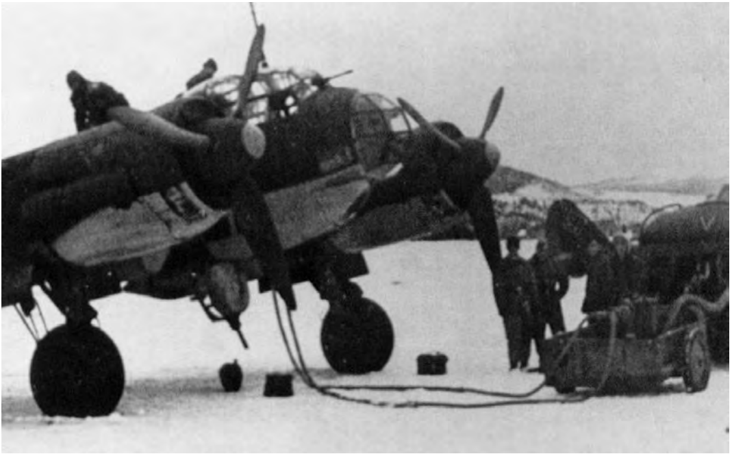
Tanking av en Junker Ju-88. Ju-88 var et jagerbombefly.

buldringen fra den store isflata, som vi hørte helt nede på Sæterbakken hvor jeg bor, skjønte vi at isen la på seg, som det heter på lokaldialekten.