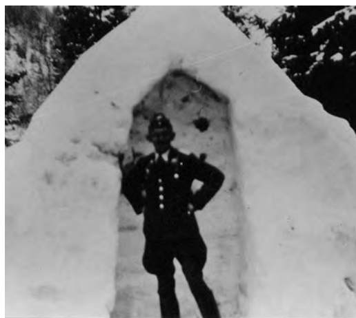
En tysk flyoffiser i et primitivt “skilderhus” i april 1940.

Førjulsvinteren 1939 var uvanlig kald og hard. Isen på Jonsvatnet var allerede ved juletider halvmeteren tykk. Kulden fortsatte over jul og inn i det nye år. Av