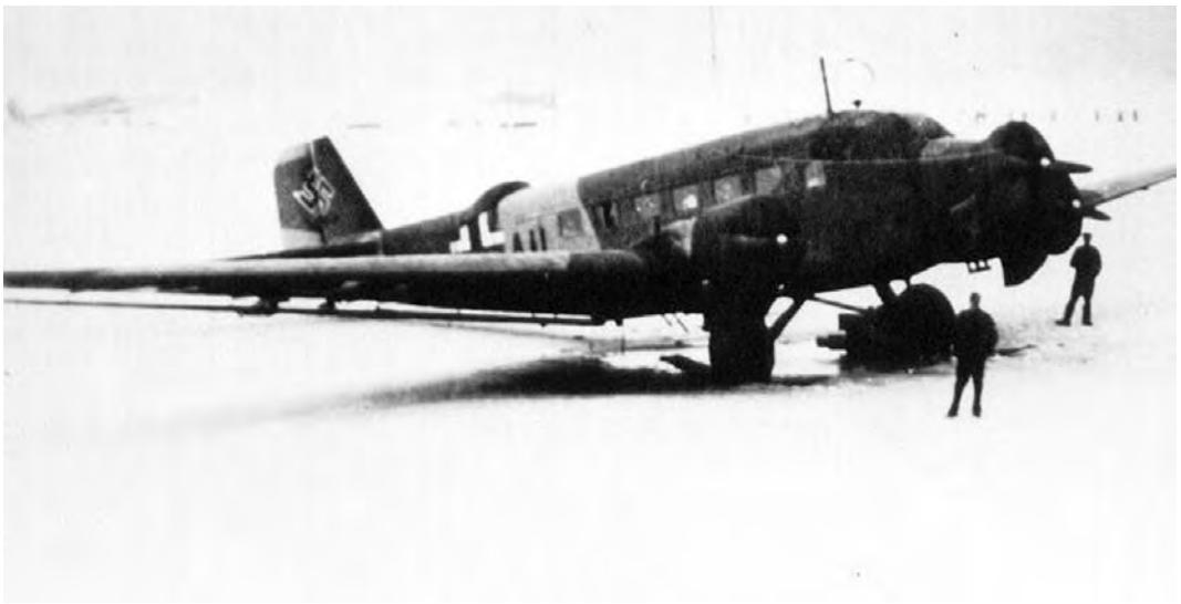
Junker Ju-52, et av de mest anvendte troppetransportfly, er i ferd med å gå gjennom isen i april 1940, etter at de ble overrasket av tøvær og overvann. Flyet ligger på bunnen fortsatt.

Rundt en halv times tid etter angrepet raste flere ambulanserbiler forbi Sæterbakken oppover mot Jonsvatnet. De var