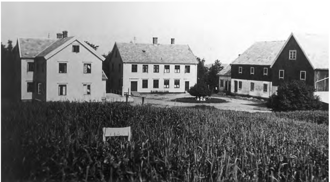
Pineberg gård.

Dalen gård har gitt navn til Dalen hageby. Området ble opprinnelig utskilt fra Rønningen i to husmannsplasser kalt Nerdalsplassene.