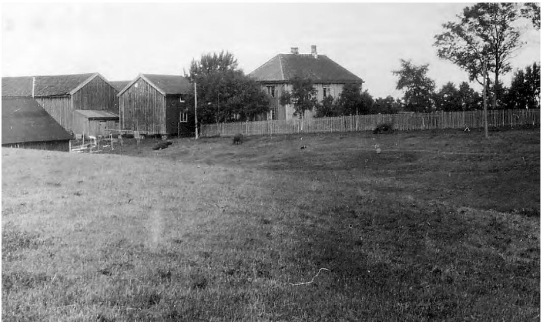
Belbuan. Postkort brukt i 1927.

Nonnene levde ganske sikkert et meget nøysomt og gudfryktig liv, men uansett dette må de ha vært flinke til å skaffe seg jordisk gods i form av store og verdifulle jordeiendommer.