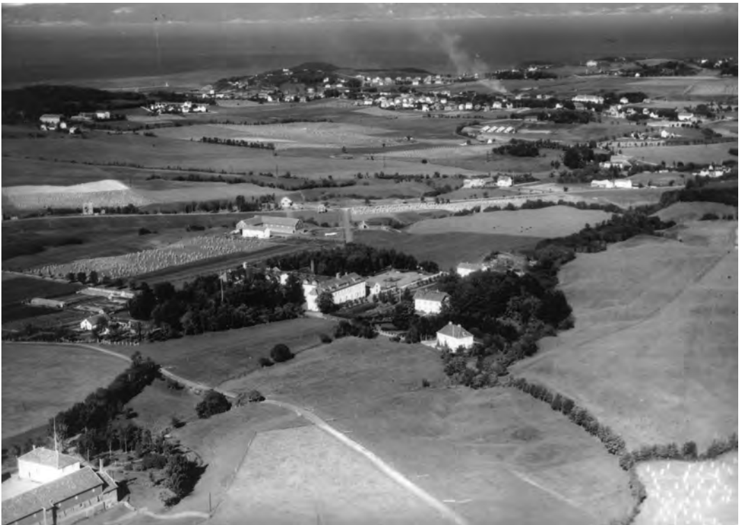
Flyfoto tatt i august 1936 av Widerøes Flyselskap. I forgrunnen er Reitgjærdet sykehus, og bak er Brøset gård slik den ble gjenoppbygd etter brannen i 1931. Nederst til venstre er Angelltrøa. Kopi fra Universitetsbiblioteket i Trondheim

Reitgjærdet ble deretter gjort om til et psykiatrisk sykehus.