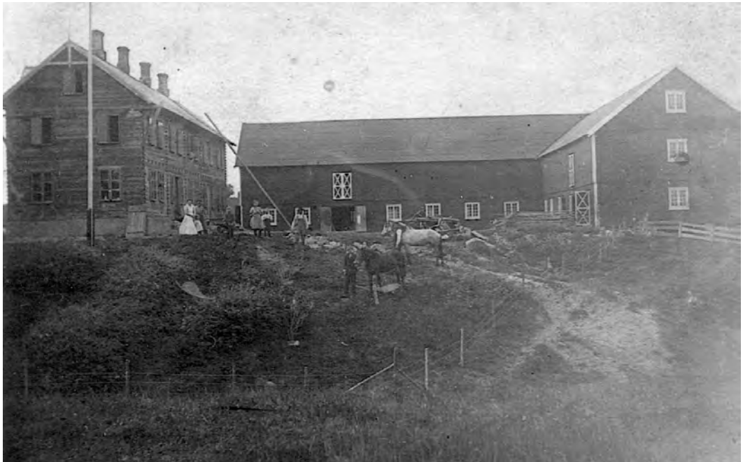
Valentinlyst under gjenoppbyggingen etter brannen i 1911.

Fasting. Lars og Havran. Jiri: The Golden Age of Trondheim – Gullalder 1760-1860. Oslo, 1997