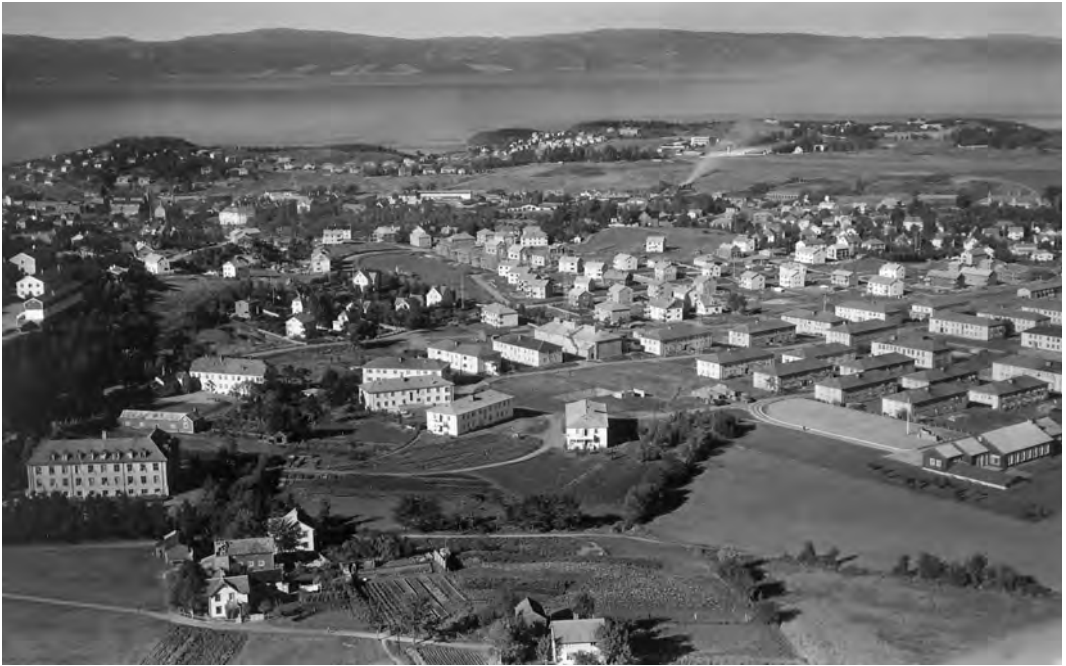
Persaune 1952. Til venstre i forgrunnen er Strinda sykehus, til høyre Persaunet leir. Bak leiren og bolighus er Rønningen gård.

Under krigen beslagla tyskerne 20 mål av eiendommen, og det ble bygget en militærleir i området. Denne leiren ble etter krigen overtatt av den norske marine.