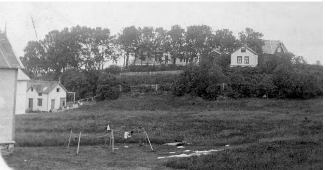
Rønningen gård. Postkort brukt i 1910.