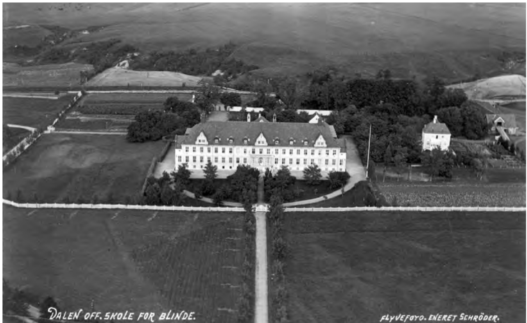
Blindeskolen. Postkort brukt i 1935.

Falkenberg ble utskilt fra Belbuan i 1777, og har sannsynligvis sitt navn et-