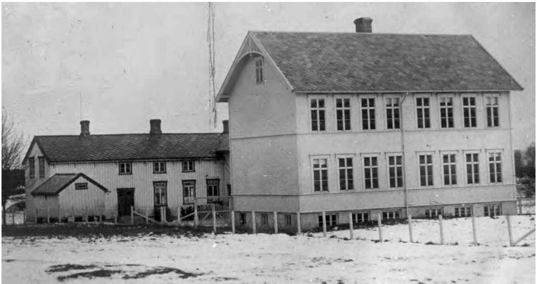
Strindheim skole. Bakerst er "gammelbygget" - hovedbygningen på gården Emilies Minde. Denne bygningen ble revet sommeren 2002. Bygningen i forgrunnen sto ferdig i begynnelsen av 1914. Bildet er tatt før dette bygget fikk et tilbygg mot vest med to klasserom i 1924.

Vi vil se litt nærmere på historien til de gårdene som har avgitt jord til utbygging av det vi i dag betegner som Strindheimområdet. I tidligere tider var det i