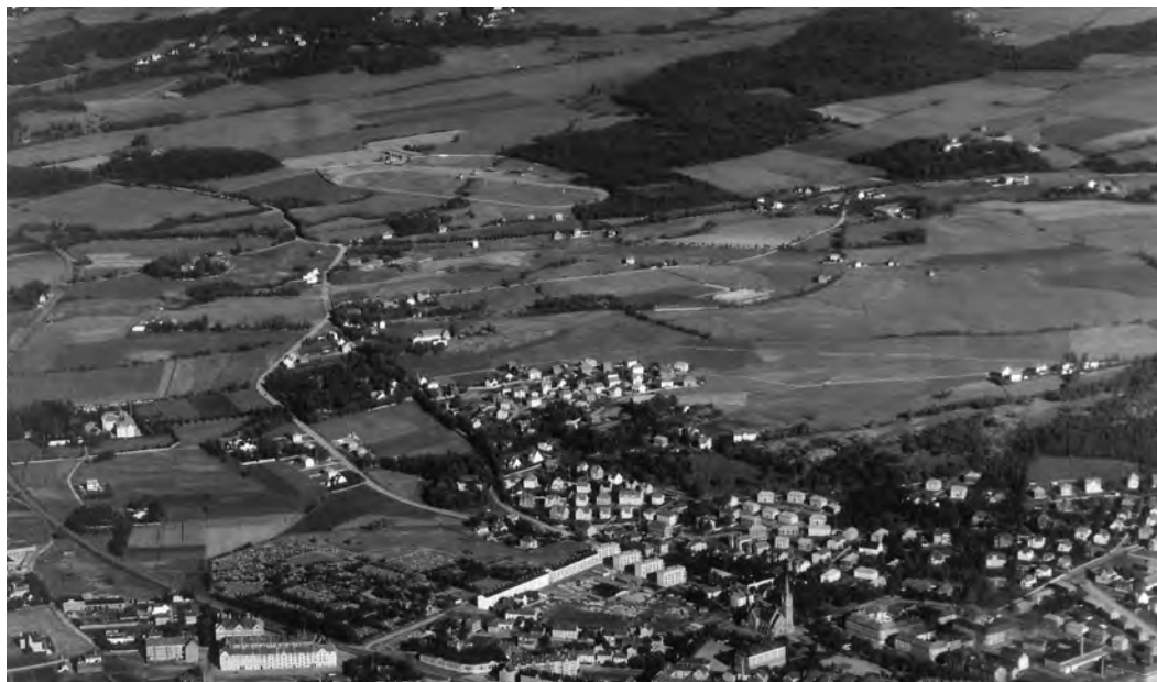
Utsnitt av flyfoto tatt august 1936 av Widerøes Flyselskap.

Kopi fra Universitetsbiblioteket i Trondheim