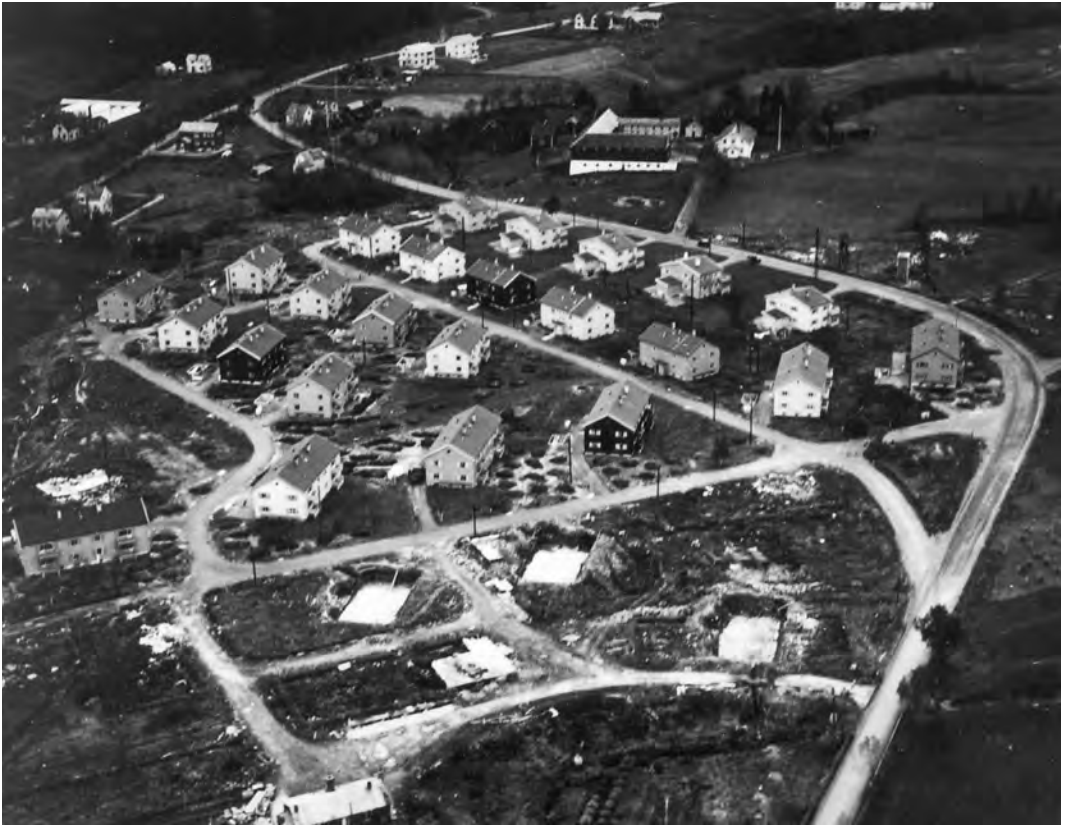
Strindheim hageby under bygging på slutten av 1940-årene. Bromstad gård er øverst i bildet. Brøtsetveien sees øverst til venstre.

gjennomsnittlig solgt 90 000 kg. Gården hadde 500 mål dyrket mark.