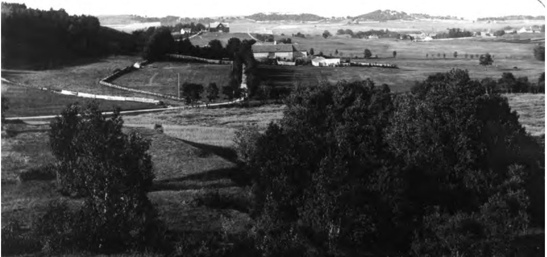
Utsikt over Persaune, Rønningen og Pineberg ca 1870.