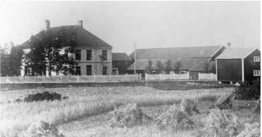
Brøset gård før brannen i 1931. Brøsetvegen går langs stakittet i forgrunnen.