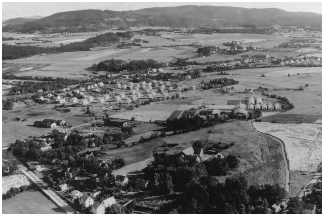
Flyfoto tatt 31. august 1951 av Widerøes Flyselskap.

Kopi fra Universitetsbiblioteket i Trondheim