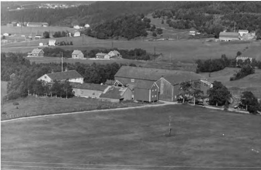
Dragvoll gård ca. 1960. I bakgrunnen til høyre: Nedre Stokkan. Lengst i bakgrunnen til venstre: Jakobsli (Grinnan)

Høsten 1981 brøt noen unge mennesker seg inn i driftsbygningen og tente bål inne på låven, og hele bygningen brant ned. En uke etter brannen gikk jeg forbi gården og så til min store overraskelse at en gravemskin hadde veltet fjøsmuren og delvis grunnmuren ned i gjødselkjelleren. Mandag morgen ringte jeg til Utbyggingssekretariatet og gjorde oppmerksom på at dette måtte bero på en misforståelse. “Universitetsnytt”