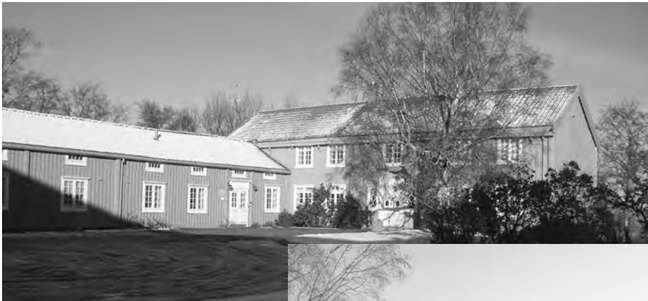
Dragvoll høsten 2003. Restaurert hovedbygning og borgstue, gjenoppbygd "fjøs" og "låve".