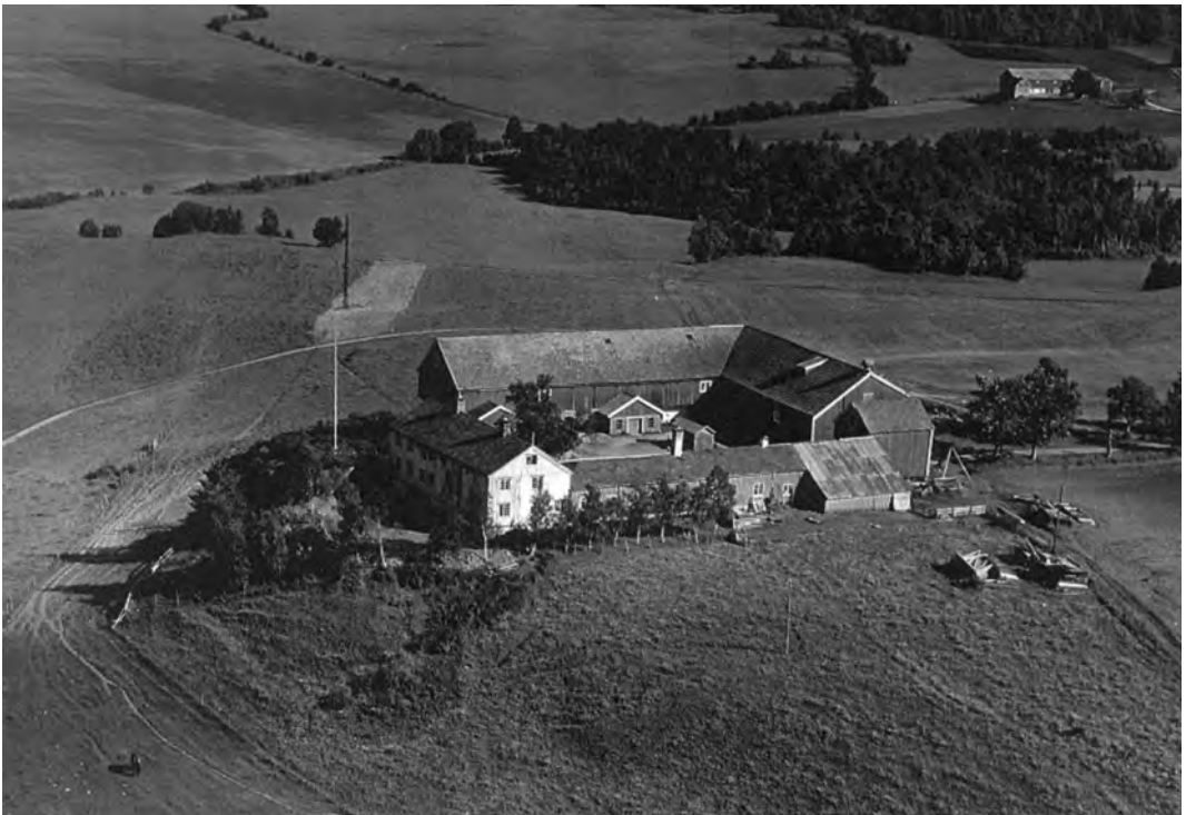
Flyfoto av Dragvoll gård i 1952. I bakgrunnen er gården Dalset. Mellom gårdene er den skogbevokste myra som ble brukt som torvmyr for torvstrø til fjøset.

Det er sannsynligvis den nåværende Stokkbekken som er opprinnelsen til første stavelse fordi ordet drag forekom-