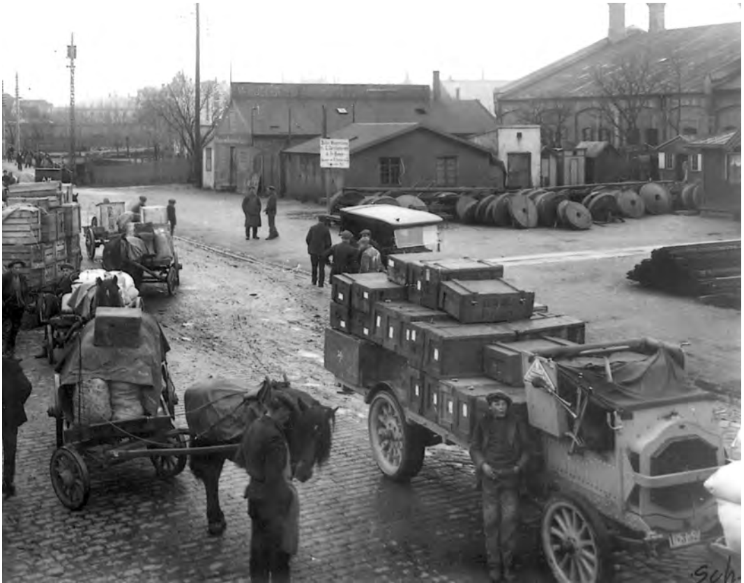
Kvernsteiner ligger klare for utskipning på Brattøra i Trondheim ca 1918. Lastebilen i forgrunnen har registreringsnummer U-352. Bilmerket er De Dion-Bouton, og eier var E. C. Dahls bryggeri.

bakker og lange omkroker. De gamle fortalte at det ett år ble kjørt snøplog på Jonsvatnet 17. mai. Det må ha vært en lang og hard vinter. Etter at det kom ny vei mellom Nedre Jervan og Flaten i 1889, kjørte man fremdeles isen. De skogløse strindabøndene kom i karavanner oppover vatnet i 20 minusgrader om morgenen på vei til allmenningen for å hogge tømmer og ved. På ettermiddagen bar det tilbake med lass. Enkelte overnatta på gårder ved øvre enden.