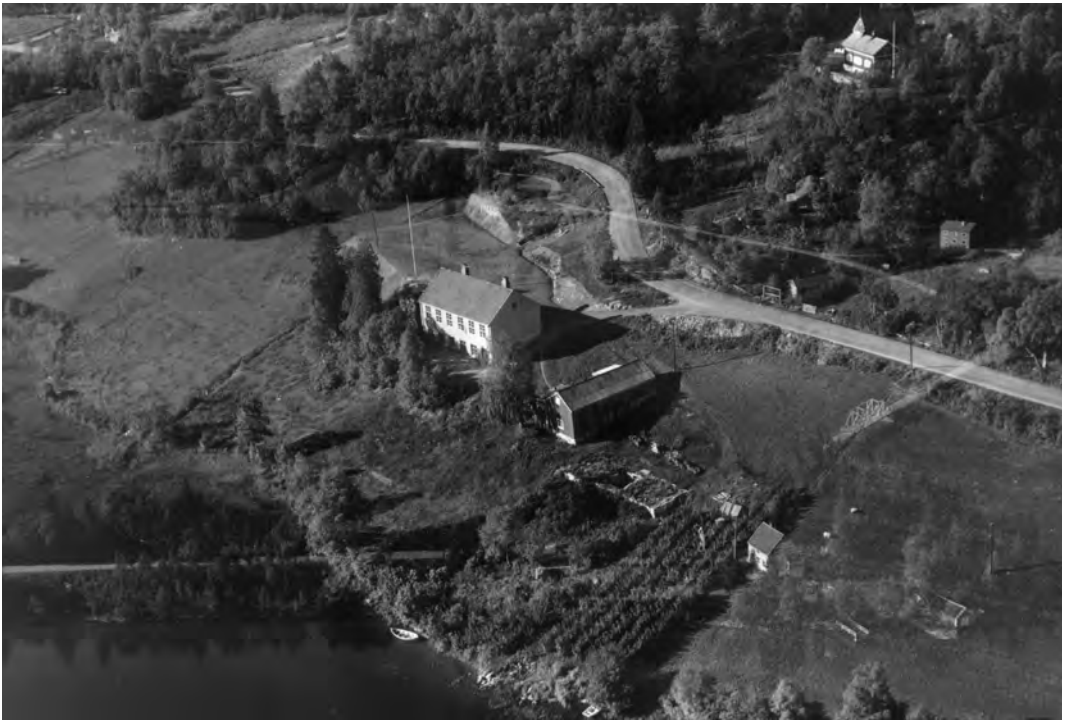
Solbakken skole, bygd i 1924. Flyfoto tatt i 1953 av Widerøes Flyveselskap. Kopi fra Universitetsbiblioteket i Trondheim.

I 1930 hadde vi den legendariske Trøndelags-utstillingen. Her var det enormt mye å oppleve. Nesten 1 million mennesker besøkte utstillinga som varte hele sommeren (for øvrig århundrets beste sommer). Norge hadde bare 3 millioner innbyggere, og Trondheim bare 40000, så en kan bare forbauses over det store besøket. De som hadde lyst på et glass øl eller to, kunne besøke et av byens mange skjenkesteder. Men i teateret gikk ikke de gamle jonsvassbygger. Det ble for fint for dem. På Folkets Hus på Ranheim var det årvisse revyer. Det falt mer i smak.