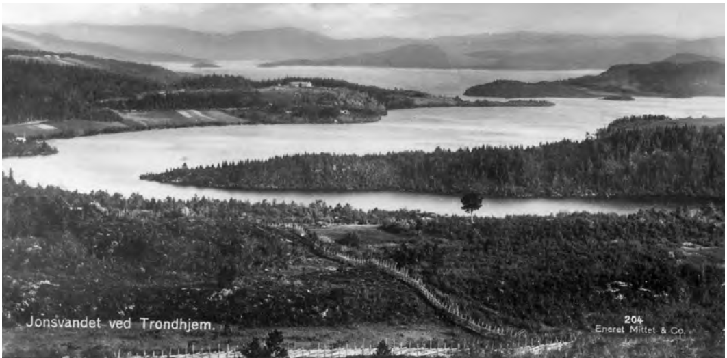
Bilde tatt fra Glinset. Nærmest er Litjvatnet og bakerst Storvatnet. Gården på bildet er Valset. Dette er et postkort fra 1920-årene. Fotografiet er eldre - samme bilde er brukt på et kort utgitt av A. Bruuns Boghandel og sendt i posten i 1909.

Ned i vatnet renner 5 - 6 store bekker og mange små. Ut renner ei elv, Vikelva. Vatnet består av Storvatnet, Litjvatnet og Kilvatnet. Vatnet er fra gammelt av brukt som ferdselsåre både sommer og vinter - i nyere tid også flyhavn. Det var mye lettere å kjøre på isen. Man slapp