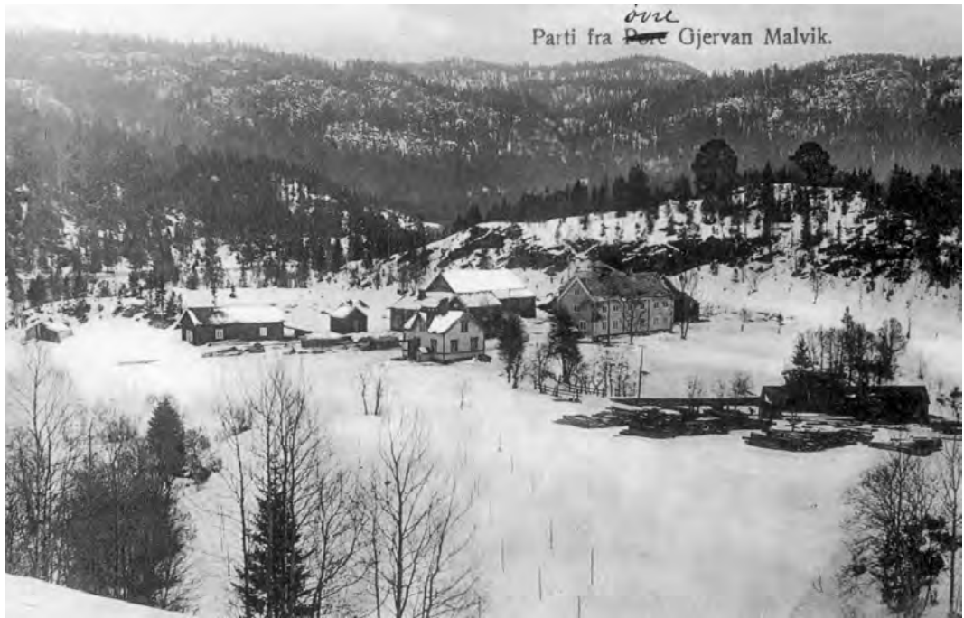
Øvre Jervan. Postkort brukt 1913. Øvre Jervan ble overført fra Malvik til Strinda i 1953.

mellom Selbu og Trondheim gikk over Jonsvannstraktene.