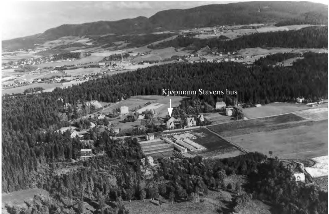
I forgrunnen er Furumoen gartneri. Kjøpmann Stavens hus er avmerket med en pil. Bildet er tatt i 1951- før den store utbyggingen startet midt i 1950-årene. Bildet er tatt vestfra.

i ryggen. Skikkelig regntøy var i de dager ukjente klesplagg for de aller fleste skolebarn. Skolebuss var et begrep som enda ikke var oppfunnet. En sjelden gang, hvis været var altfor ufyselig og det tilfeldigvis passet med bussen, kunne skolebarna få slenge seg på. Men det hendte også at en sur og uvennlig busssjåfør stengte døra foran nesen på barna, for de hadde, etter hans mening, bare godt av å gå. Mellomkrigstida, eller de harde trettiåra, var på dette området ikke akkurat barnas tidsalder. Hadde liknende episoder skjedd i dag, ville nok foreldre og foresatte ha stått på barrikadene for sine barn. En formildende omsten-