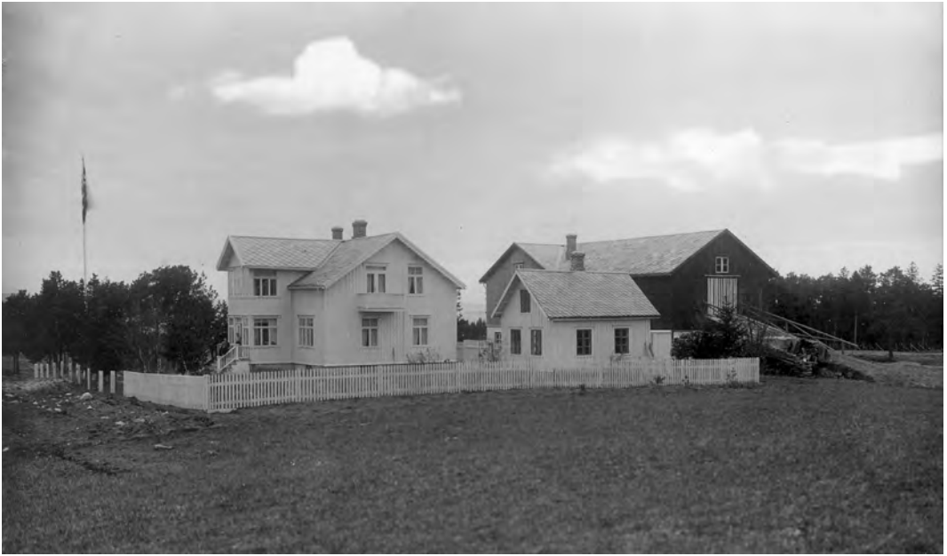
Dette bildet av gården Nyheim er tatt først på 1920-tallet og viser gårdsanlegget slik det opprinnelig var. Jakobslivegen går like bak driftsbygningen.

rende Ranheimsveien het på den tid. En tredje mulighet var å gå helt ned til jernbanestasjonen for å ta toget. Seinhøsten og vinteren bød på mang en hustrig opplevelse for de reisende, som også ofte var nedlesset med pakkenelikker av ulike slag.