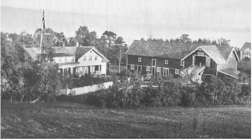
Skovgård ca 1930.