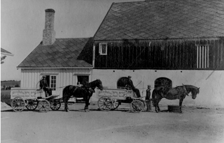
Meieriet på Angelltrøa ca 1915.