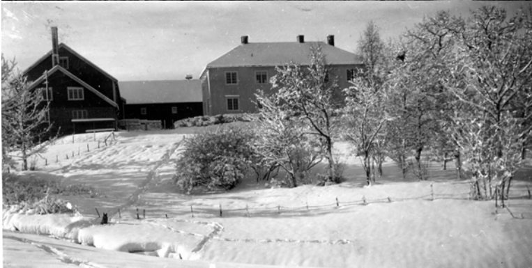
Gårdsanlegget sett fra nord ca. 1920 og ca. 1950.