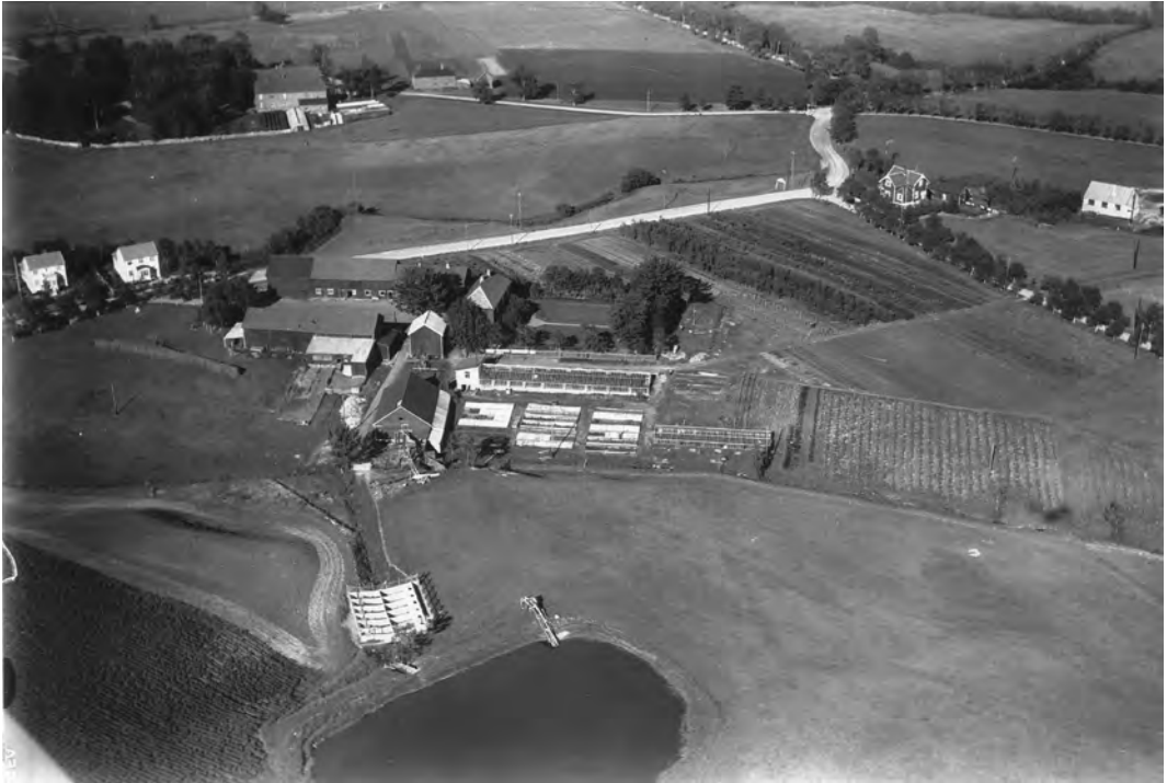
Belbuan ca. 1935. Foran en del av isdammen og nutriafarmen. Opp til høyre en del av planteskolen, samt Gildheimkrysset. Riksveg 50 går tvers over bildet. I bakgrunnen Louiselyst gård.