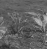
Belbuan - hagen.