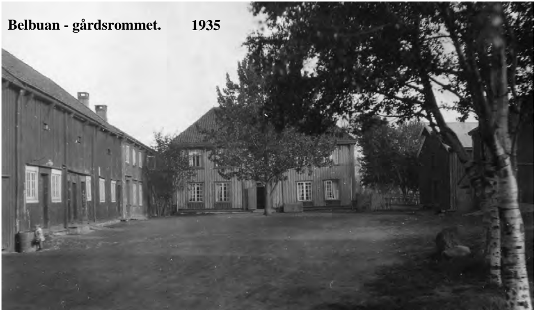
Belbuan - gårdsrommet. 1935

Først på 30-tallet ble det av interesserte forretningsmenn i Trondheim gjort forsøk med oppdrett av pelsbever (Nutria) på Belbuan. Farmen ble anlagt nedenfor