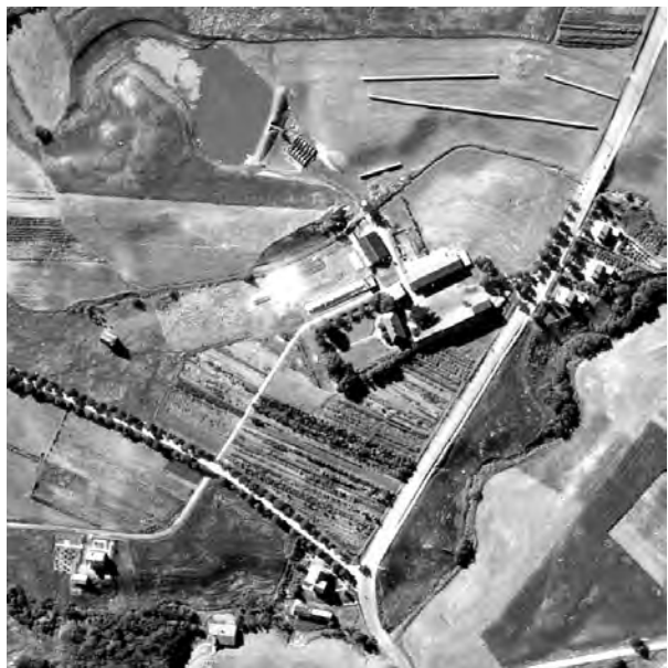
Utsnitt av flyfoto fra før 1940.

Under navn av Belbuan Hagebruk og Planteskole ble det de første årene, ved siden av å utvikle planteskolen, som nevnt drevet en