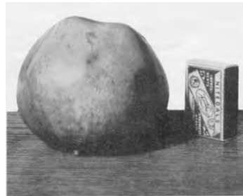
Melhuseple kan bli opptil 700 gr. Sykdomsfritt og lite kravsamt.

Malvikeple. B.—H. Lokalsort frå Malvik i Sør-Trøndelag. Middelsstort eple av pen farge. Held seg godt til mai. Eit verdfullt eple for Trøndelag.