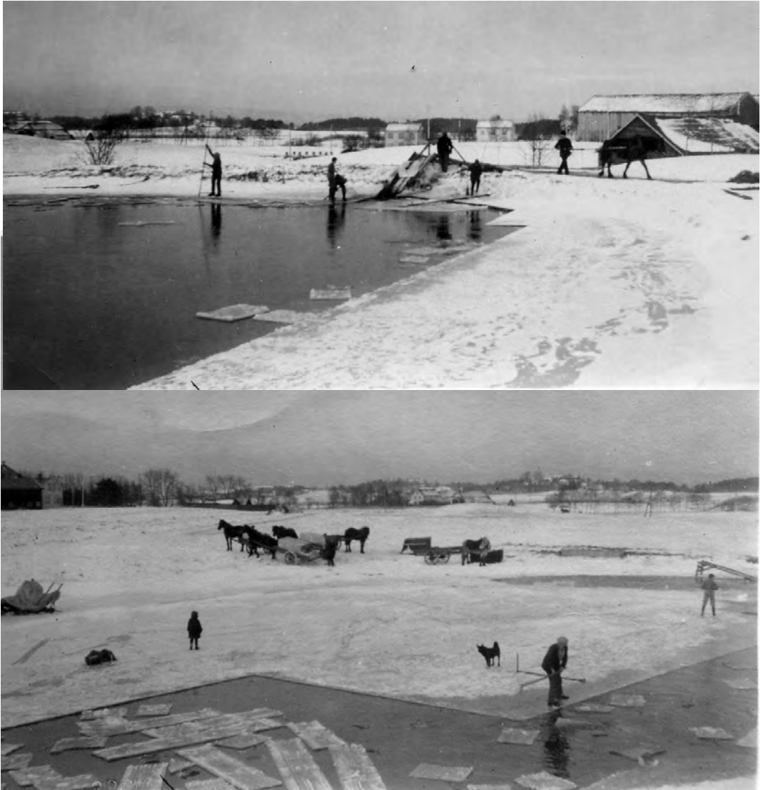
Fra skjæring av is på dammen på Belbuan ca. 1930.