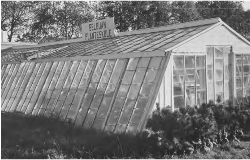
Planteutsalget ca 1955.

skapets sortsliste anbefalt for planting i Trøndelag og Nord-Norge.