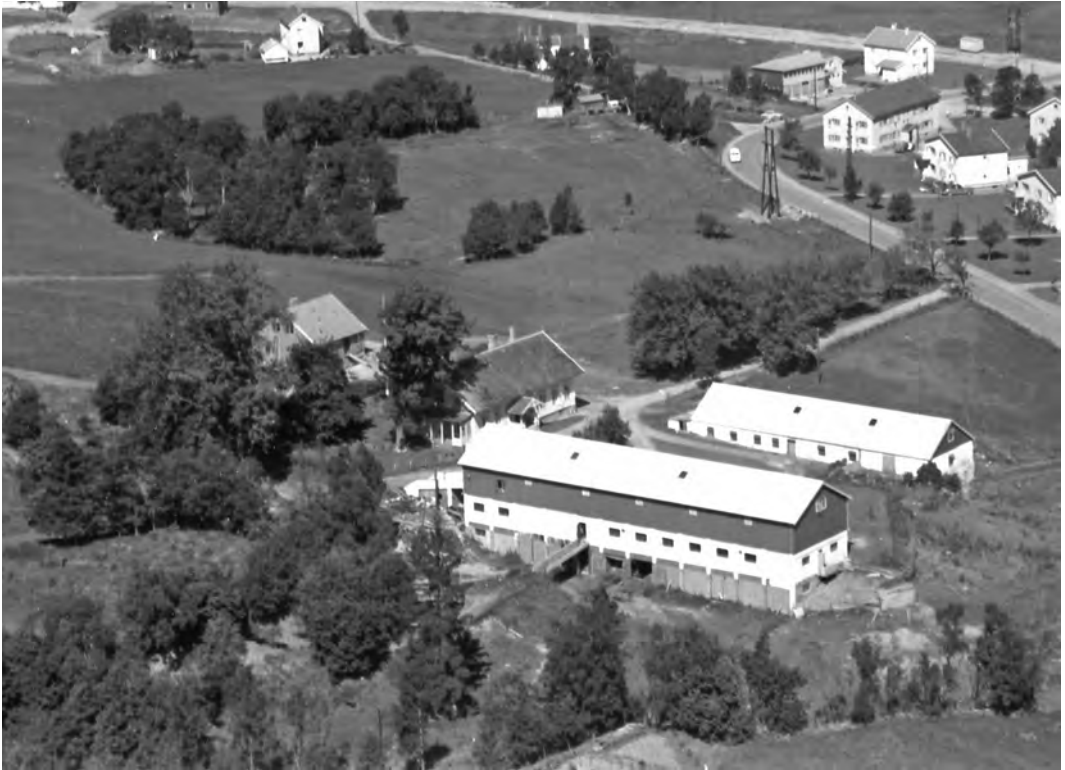
Bromstad gjenoppbygd etter brannen - flyfoto tatt 24. juni 1960.