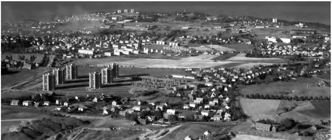
Flyfoto tatt mot nord 12. september 1968. I forgrunnen til venstre er Valentinlyst gård og høyblok- kene i Valentinlyst borettslag. Helt til venstre er Persaune borettslag. Jordene midt på bildet er Bromstads jorder. I forgrunnen (i midten) ligger gården Lille Reitgjerdet (Buckhaugen) og til høyre gården Reitgjerdet (hvor Strinden teglverk var). Bak Reitgjerdet er jordene på Brøset (Reitgjerdet sykehus).