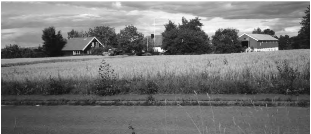
Siste skuronn før siste ekspropriasjon - i 1990. Vegen i forgrunnen er Bromstadekra.

UEH forutsatte bygging av punkthus i sitt forslag til reguleringsplan, en plan gårdeieren for øvrig aldri fikk se. I gård-