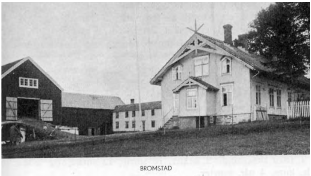
Husene på gården før brannen - bilde i Strinda bygdebok bind I utgitt i 1939.

Brannen ble en føljetong i avisene etter som den antatte ildspåsetteren var pasient ved Reitgjerdet sykehus og hadde frihet til å bevege seg hvor han ville denne skjebnesvangre søndagen. Det ble en opphetet debatt om hvordan det kunne gå til at en pasient, som ifølge avisene var sikringsfange og erklært sinnssyk allerede under et opphold i Botsfengslet i Oslo i 1951, kunne få bevege seg fritt uten tilsyn. Ifølge pressen var han tidligere siktet for to ildspåsettelse og dømt for vold. Sinnssykeerklæringen kunne bety at mannen ikke var tilregnelig og derfor ikke kunne straffes. Det kunne bli snakk om å forlenge sikringen og opp-