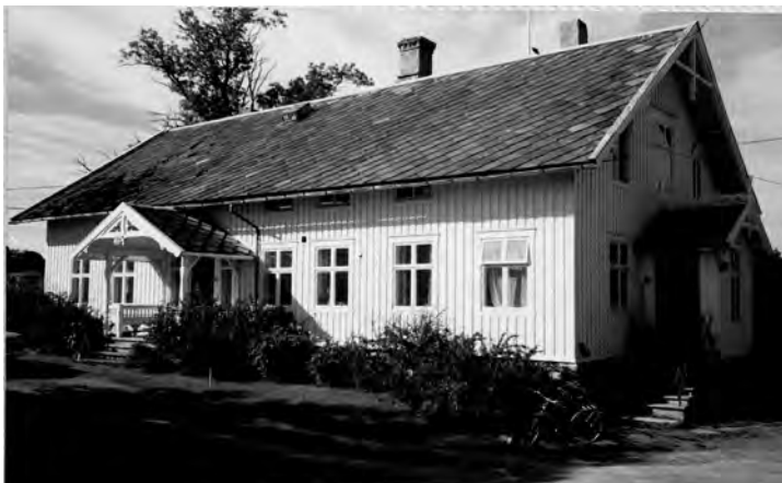
Hovedlåna (fra 1878) som ble berget under brannen.

Den første ekspropriasjonen kom i 1957. Da ble deler av Kong Øysteins vei