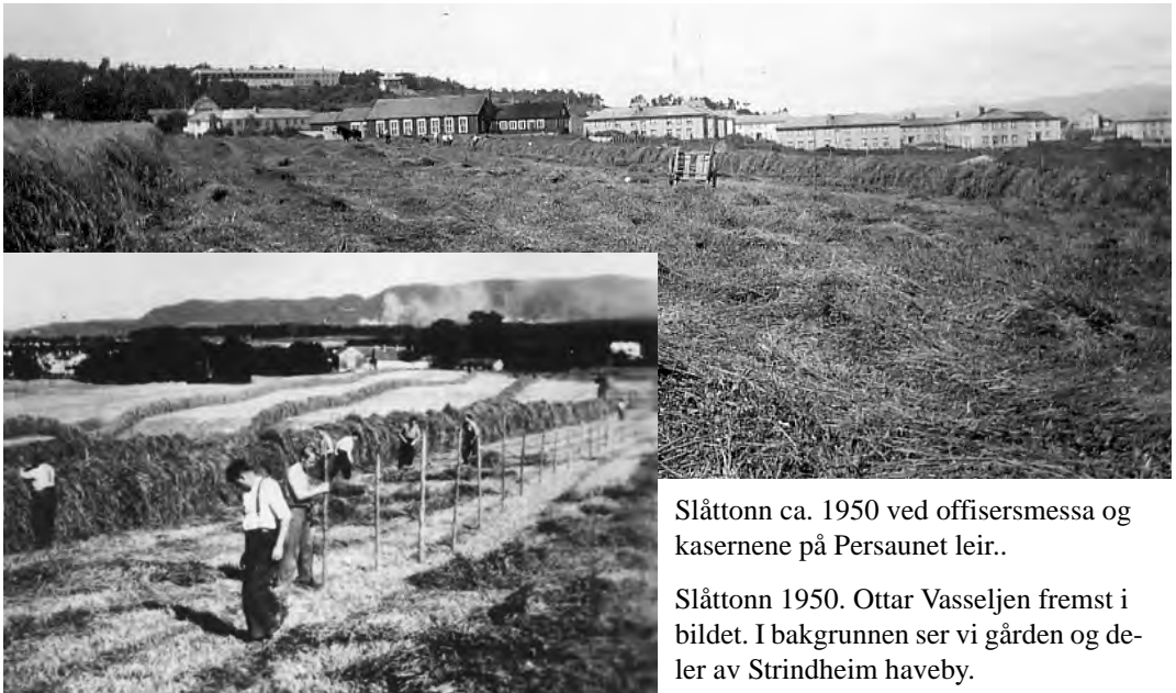
Slåttonn ca. 1950 ved offisersmessa og kasernene på Persaunet leir..

På Bromstad bodde de to drengene og melkeguttan på hvert sitt loft i bårstua. Tausa, som arbeidet inne sammen med